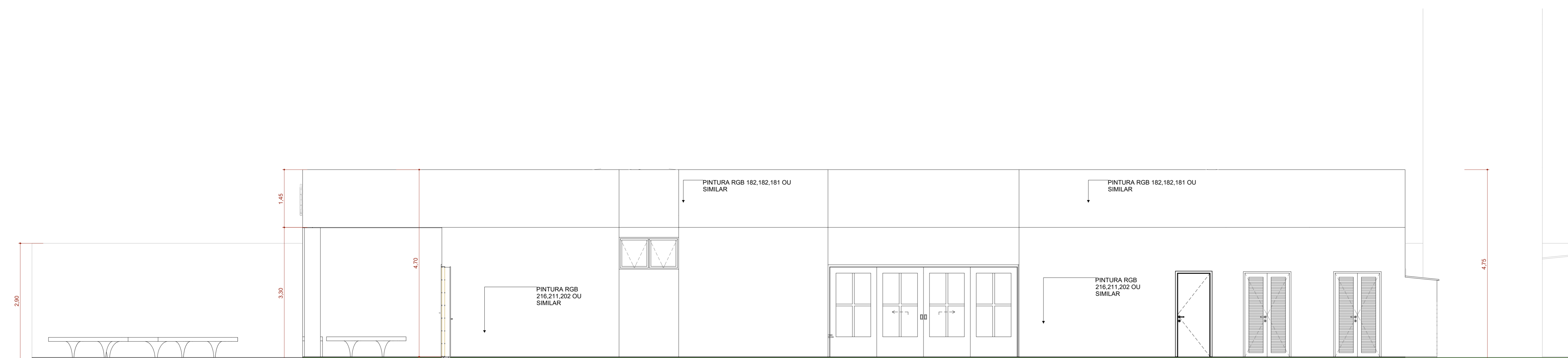
F4 FACHADA DIREITA Escala: 1:50