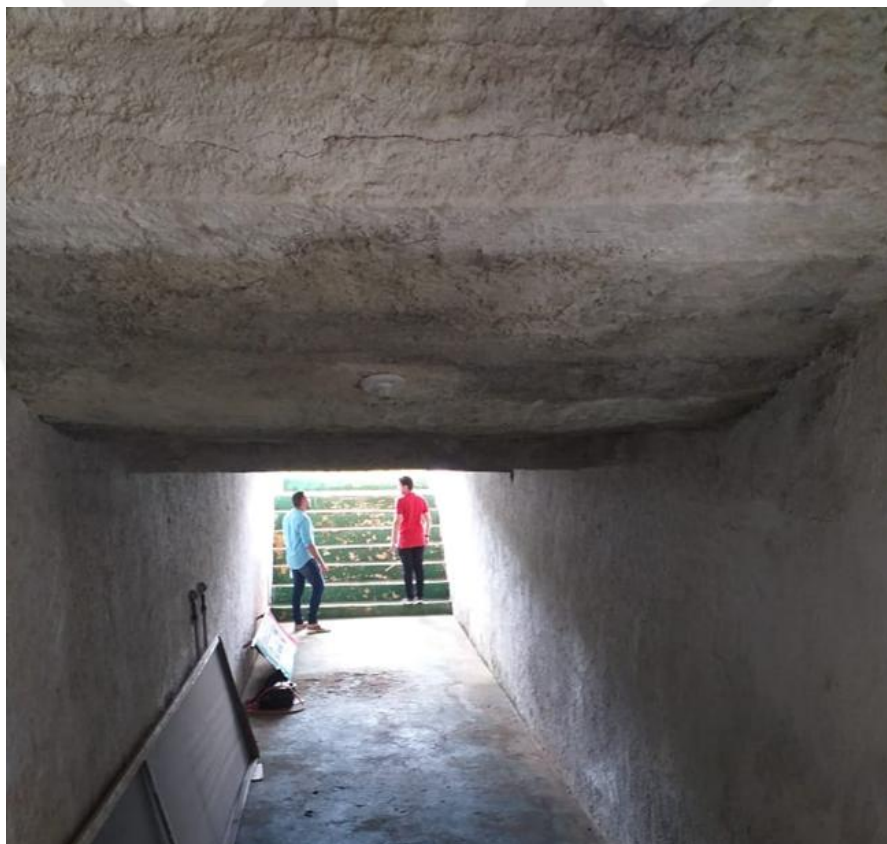
Foto 9: Vista frontal do túnel que será demolido para construção de 2 novos;