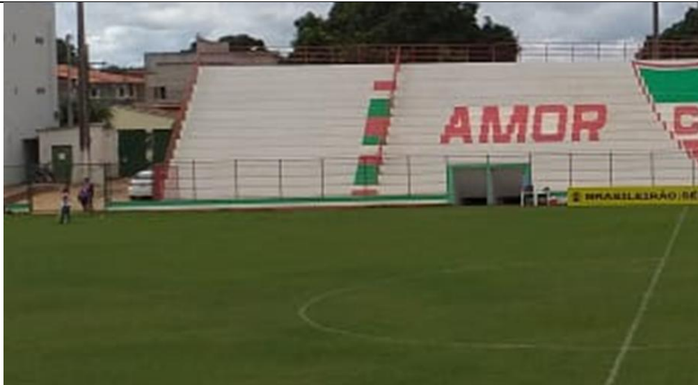
Foto 8: Túnel que será demolido para construção de 2 novos túneis;