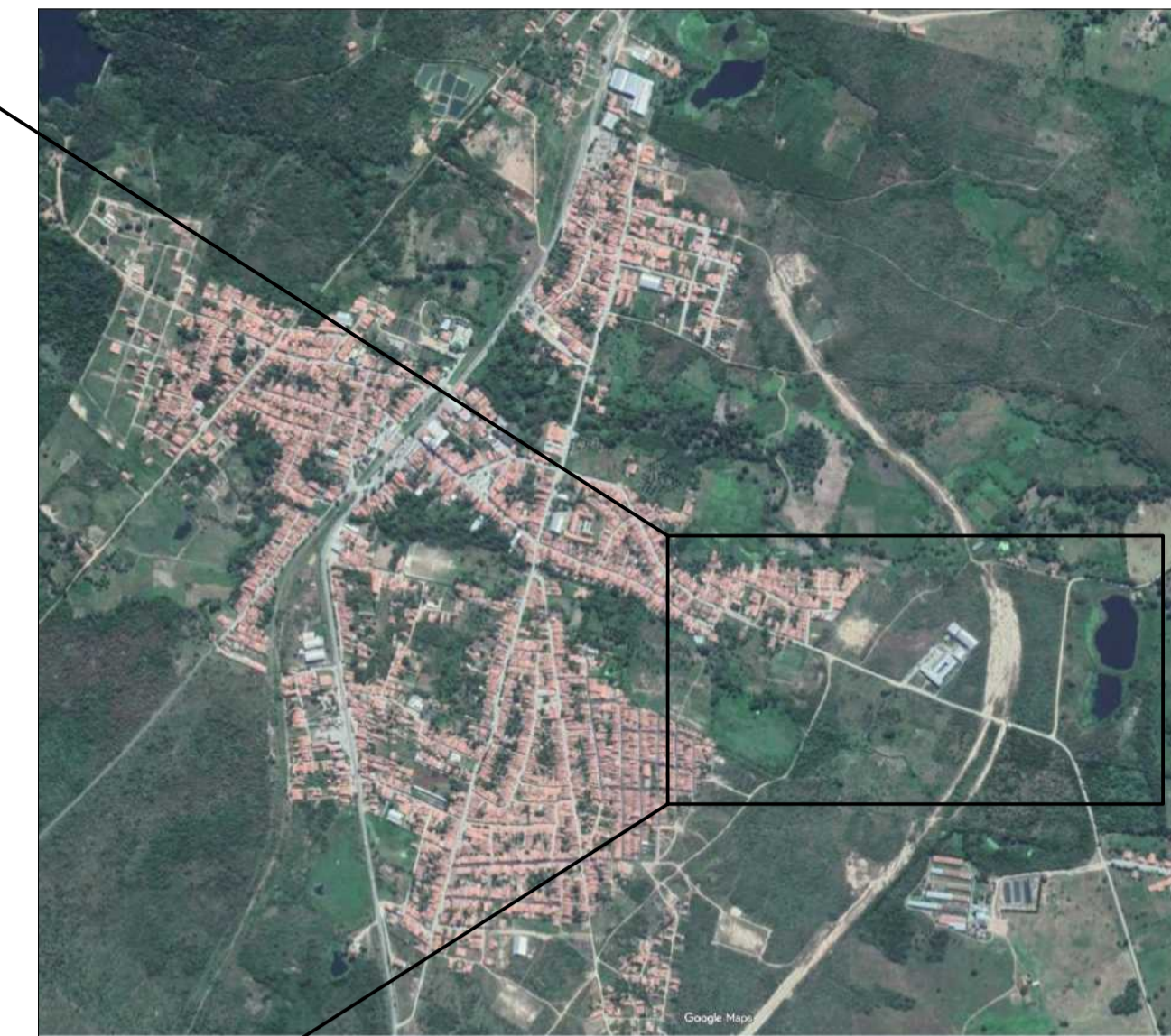
REFERÊNCIA DE LOCALIZAÇÃO MUNICÍPIO DE GUAÍUBA, CE

PROJEÇÃO UNIVERSAL TRANSVERSA DE MERCATOR DATUM OFICIAL - SIRGAS2000 MERIDIANO CENTRAL 39° WGR