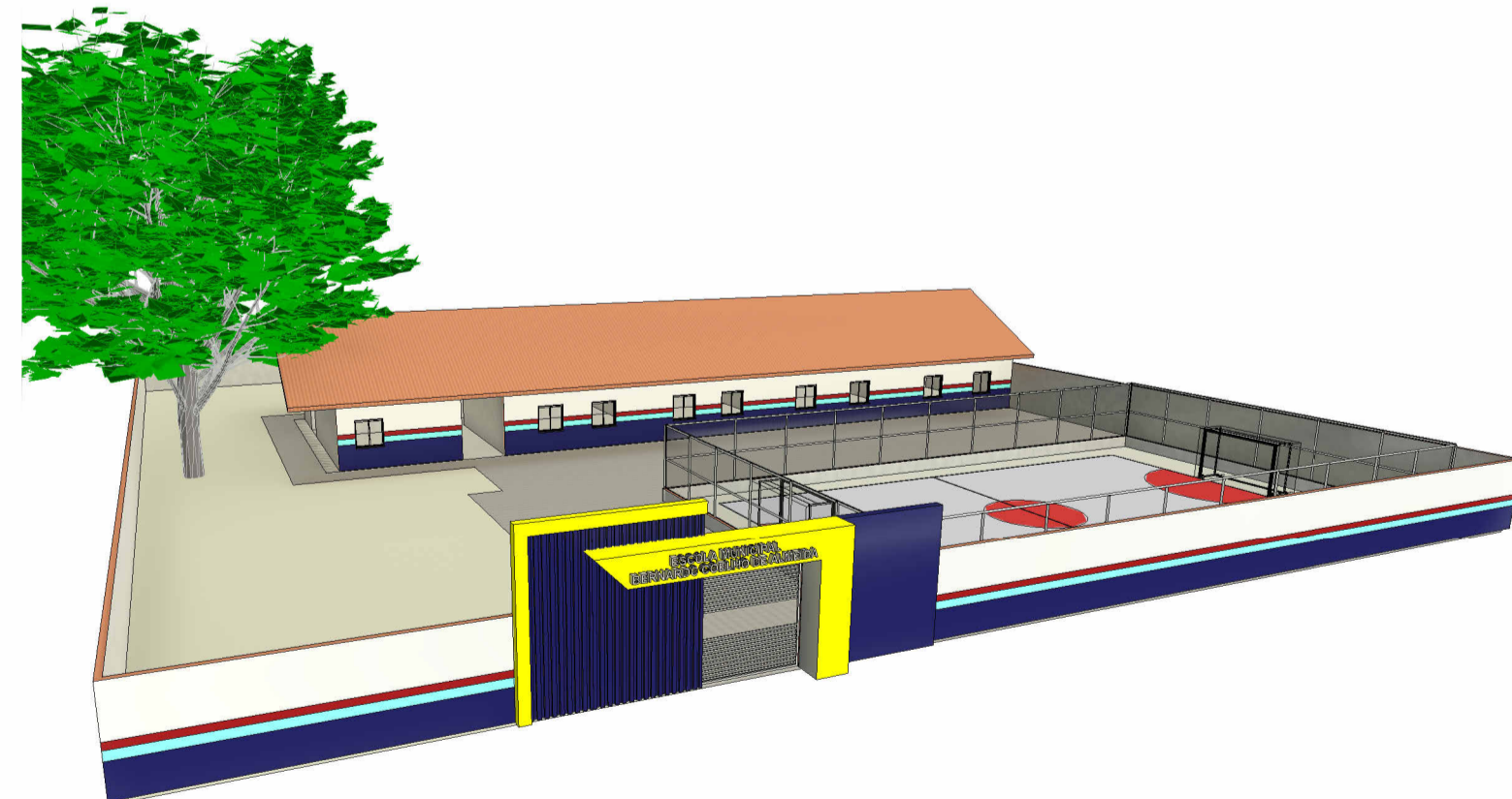
2 Vista 3D 1