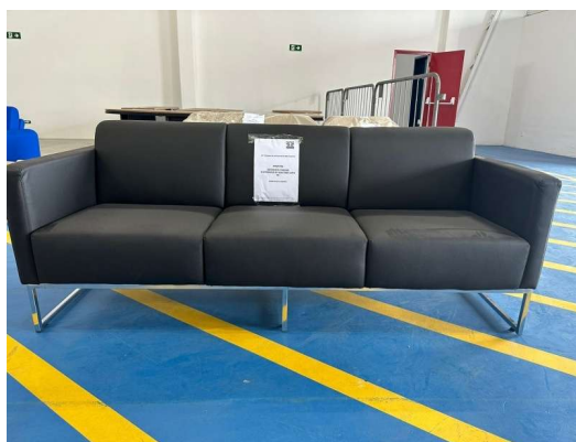
Figura 3: Sofá 3 lugares