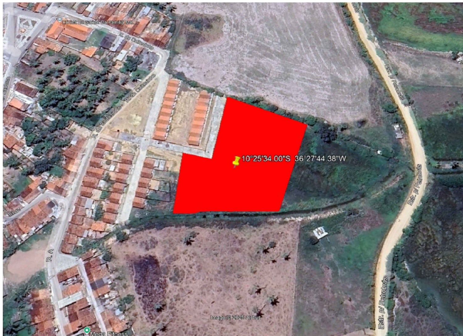
IMAGEM DE SATÉLITE – MAPA DE SITUAÇÃO CONJ. MÁRIO CRUZ 10°25'34.00"S 36°27'44.38"W SEM ESCALA