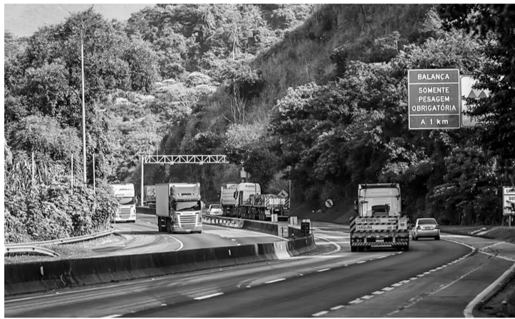
■ Fiscalização do cumprimento das novas regras será automática e em larga escala, abrangendo todo o território nacional

Segundo o diretor-Geral da ANTT, Guilherme Theo Sampaio, será publicada uma resolução que prevê gatilhos para ajustar o valor do frete mínimo de forma mais ágil,