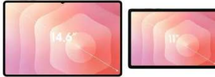
Galaxy Tab S11

Imagem ilustrativa. Para mais informações sobre o produto, acesse: https://www.samsung.com/br/pt/galaxy-tab-s11-ultra/