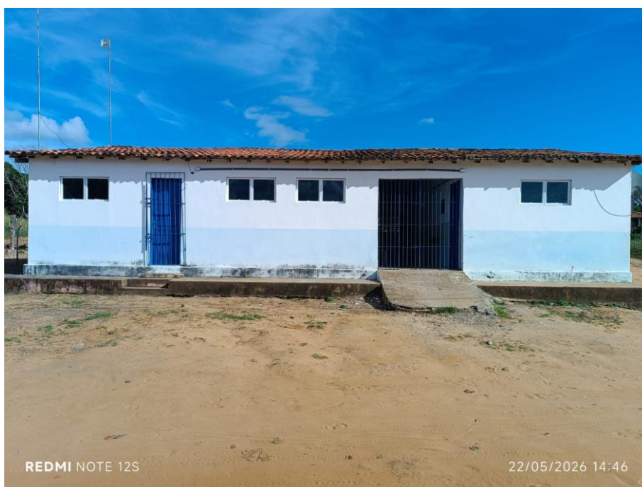
São José_Pov. Terra Dura

A necessidade de contratação de serviços comuns de engenharia, sob demanda, abrangendo atividades de demolição, conserto, operação, conservação, reparação, adaptação e manutenção preventiva e corretiva, decorre da exigência legal e administrativa de assegurar o funcionamento pleno, eficiente e contínuo da rede municipal de ensino de Água Fria/BA, em estrita observância ao princípio da continuidade do serviço público e da eficiência, preconizados pelo Art. 5º da Lei nº 14.133/2021.