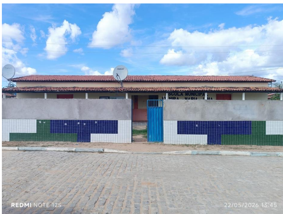
N. Sra. da Conceição_Pov. Maracaiá