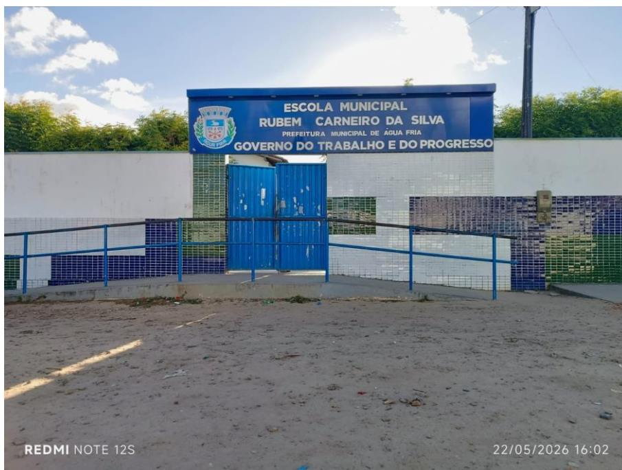
Rubem Carneiro da Silva_Centro