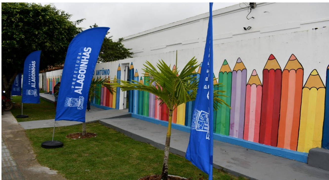
Figura 1 – Área destinada à obra de ampliação da Creche Santo Antônio