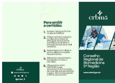
5.1 Frente 1