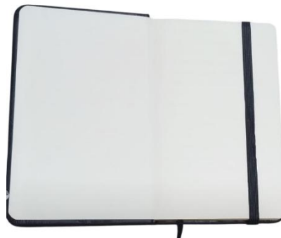
1.3 Figura Erro! Nenhum texto com o estilo especificado foi encontrado no documento. -2 - Caderneta aberta - folha de rosto