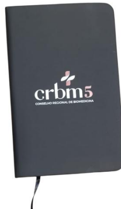
1.2 Figura 2 - Foto externa da caderneta