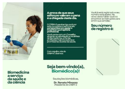
5.2 Verso 1