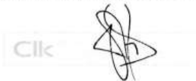
Jeandro Laytynher Ribeiro manuscript_22 mai 2025, 10-42-52.png

Assinatura manuscrita com hash SHA256 prefixo 9b636e[...]