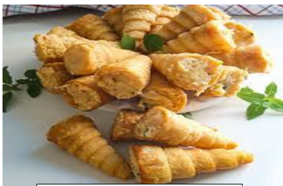
ITEM 16 – RABO DE TATU *Imagem meramente ilustrativa