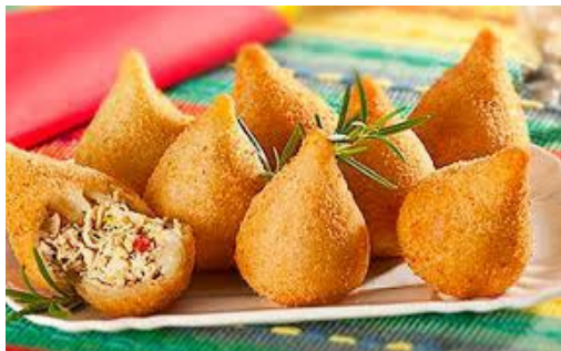
COXINHA DE FRANGO *Imagem meramente ilustrativa