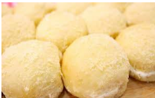
ITEM 14 – PÃO DE QUEIJO *Imagem meramente ilustrativa