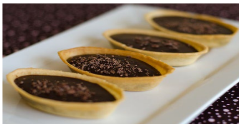
ITEM 1 – BARQUETE DOCE *Imagem meramente ilustrativa