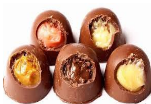
ITEM 23 – TRUFA