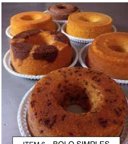
ITEM 6 – BOLO SIMPLES *Imagem meramente ilustrativa