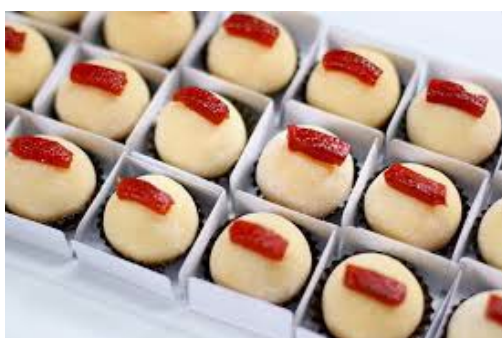
ITEM 20 – ROMEU E JULIETA