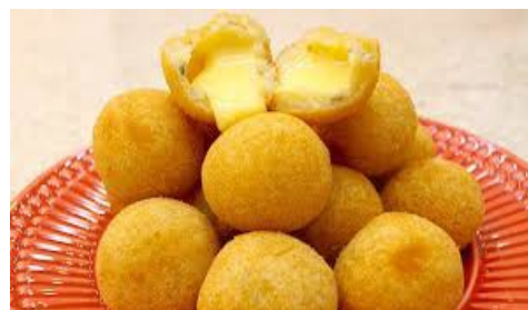
ITEM 5 – BOLINHO DE QUEIJO *Imagem meramente ilustrativa