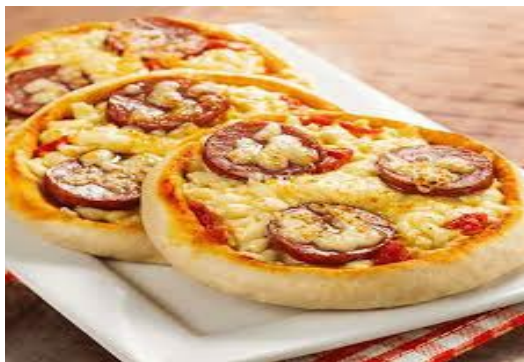
ITEM 24 – PIZZA BROTINHO *Imagem meramente ilustrativa