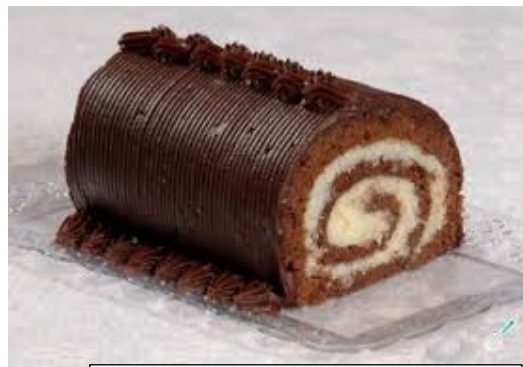
ITEM 19 – ROCAMBOLE DOCE