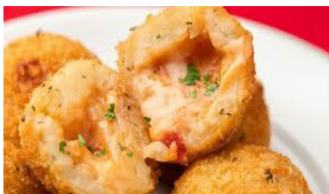
ITEM 4 – BOLINHO DE PIZZA *Imagem meramente ilustrativa