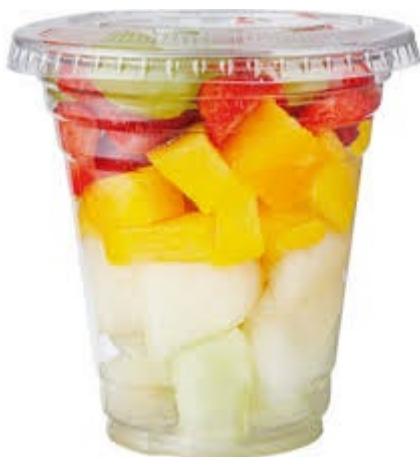
ITEM 26 – SALADA DE FRUTAS *Imagem meramente ilustrativa