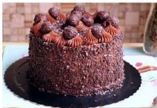
ITEM 7 – BOLO C/ RECHEIO E COBERTURA *Imagem meramente ilustrativa