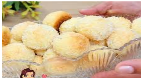
ITEM 13 – GOIABADA COM COCO *Imagem meramente ilustrativa