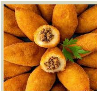
ITEM – 3 BOLINHO DE CARNE *Imagem meramente ilustrativa