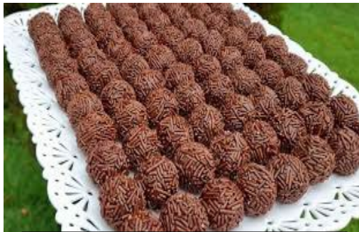
ITEM 8 – BRIGADEIRO *Imagem meramente ilustrativa