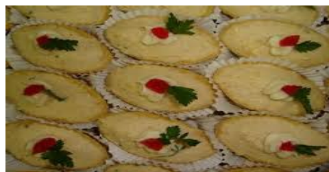
ITEM 1 – BARQUETE SALGADA *Imagem meramente ilustrativa