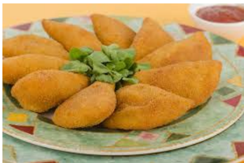
ITEM 18 – RISOLE DE FRANGO E QUEIJO