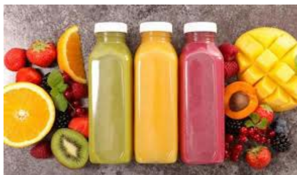
ITEM 27 – SUCO DE FRUTA NATURAL *Imagem meramente ilustrativa