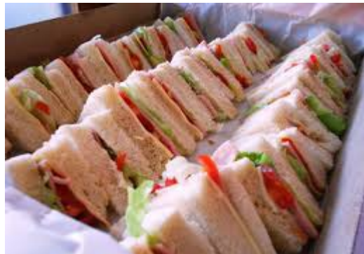
ITEM 25 – SANDUÍCHE NATURAL *Imagem meramente ilustrativa