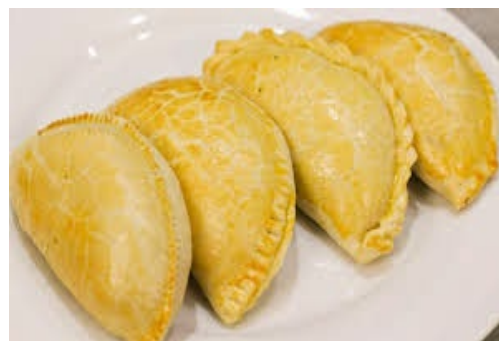
ITEM 15 – PASTEL DE FORNO *Imagem meramente ilustrativa