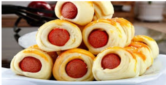
ITEM 12 – ENROLADINHO DE SALSICHA *Imagem meramente ilustrativa