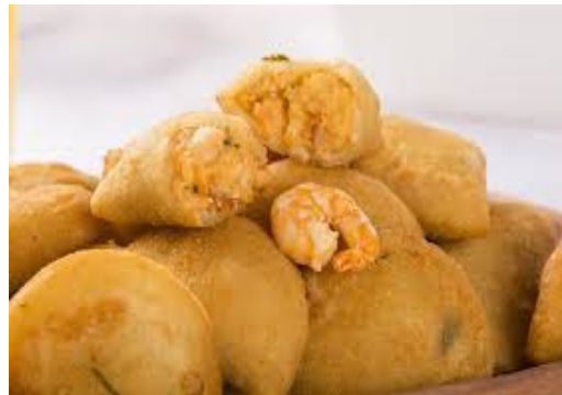
ITEM 17 – RISOLE DE CAMARÃO *Imagem meramente ilustrativa