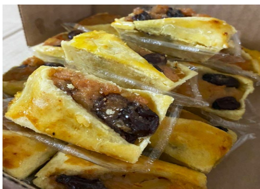
ITEM 22 – TROPICAL