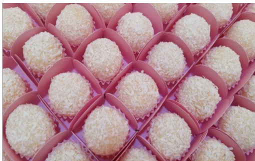
ITEM 2 – BEIJINHO *Imagem meramente ilustrativa