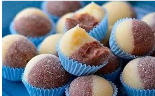
ITEM 9 – CASADINHO *Imagem meramente ilustrativa