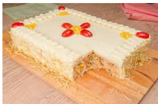
ITEM 21 – TORTA SALGADA