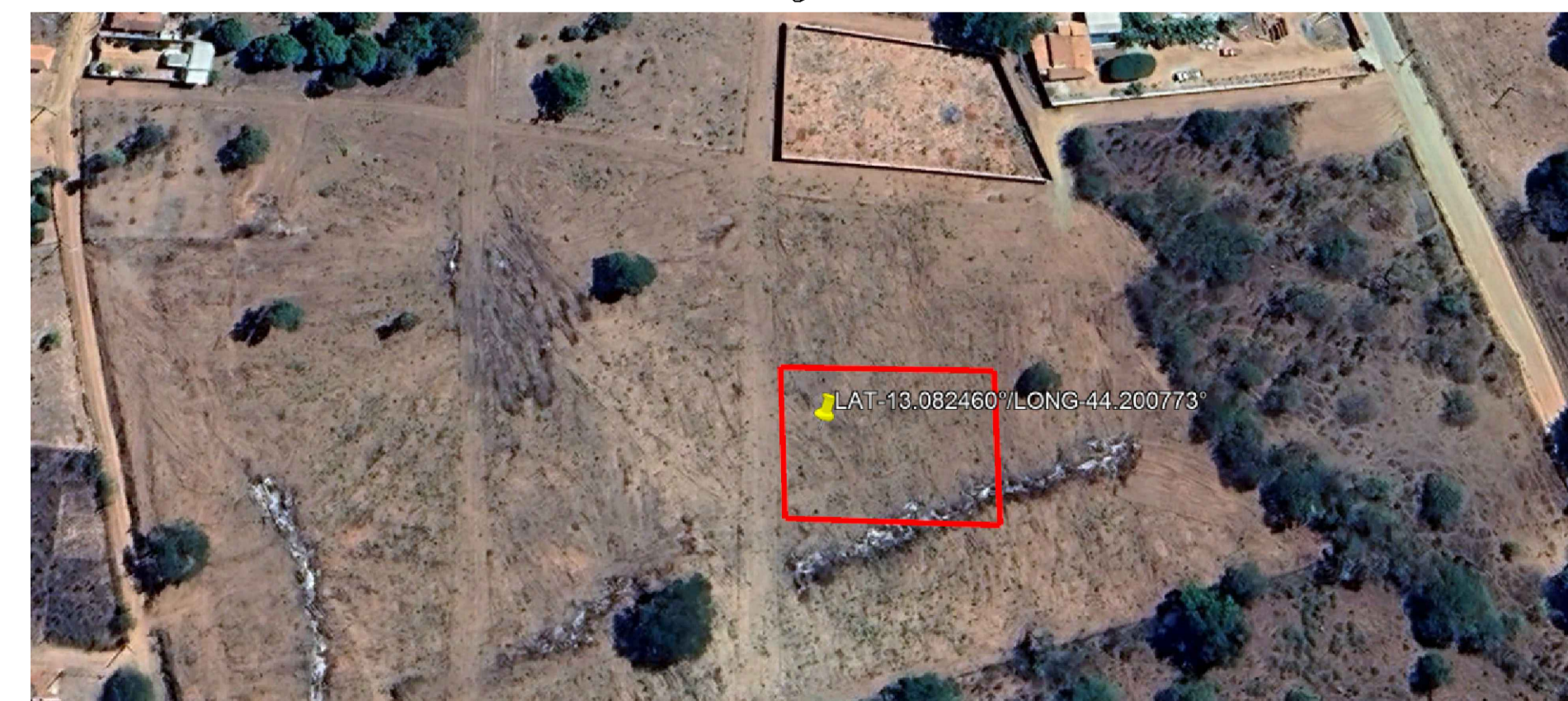
PLANTA DE SITUAÇÃO