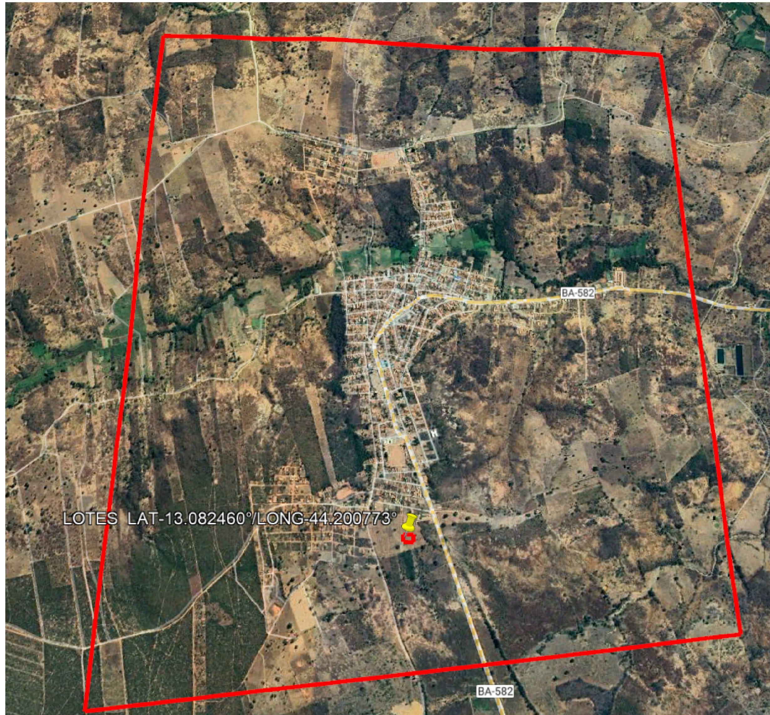
LIMITE DE EXPANÇÃO URBANA