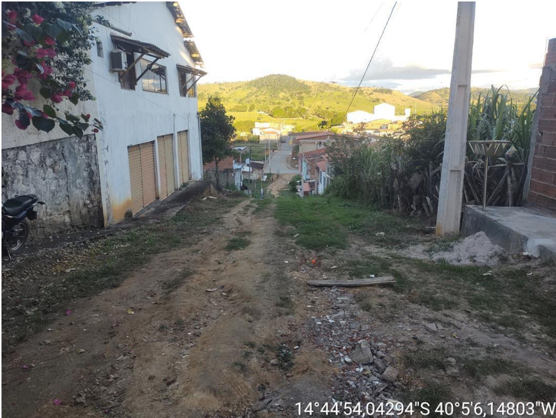
RUA VALDECI GERMANO