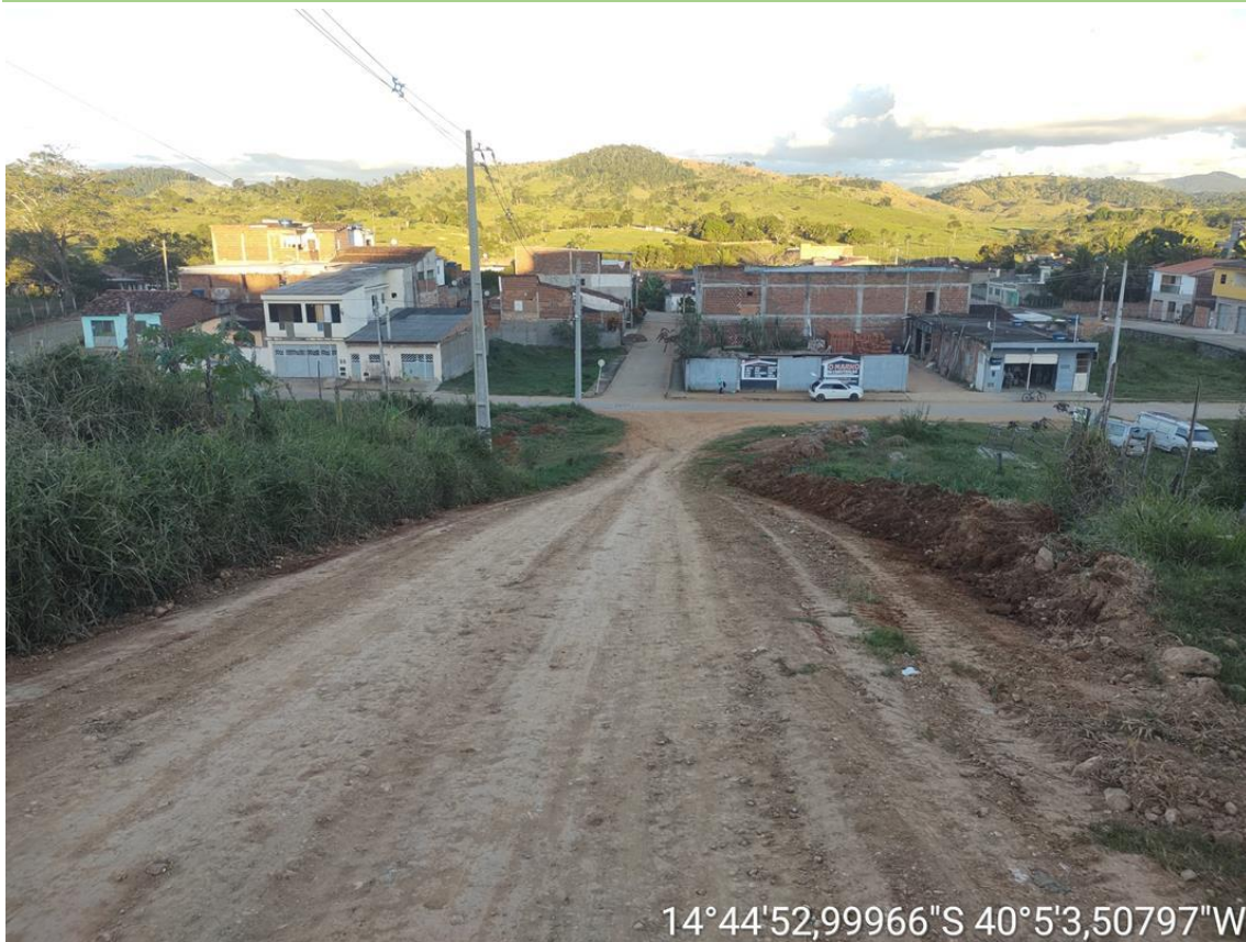
RUA VALDECI GERMANO 02