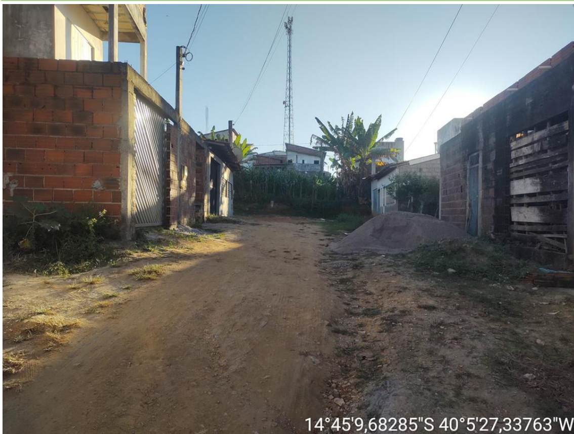
RUA JOÃO DURVAL CARNEIRO