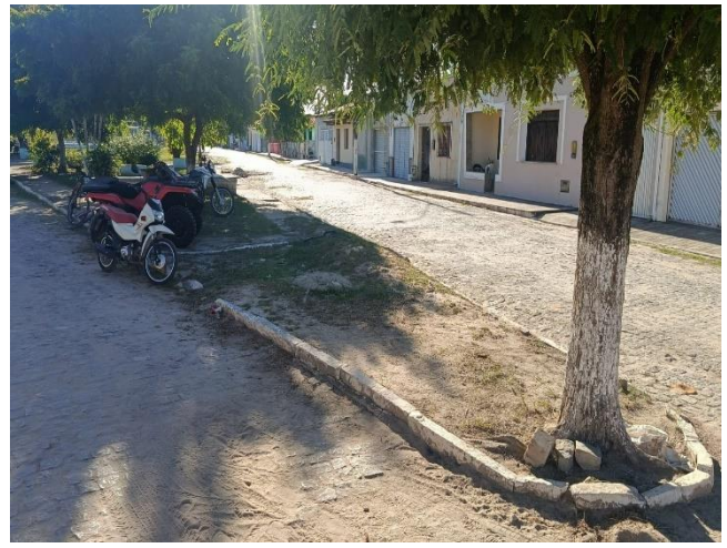
PAVIMENTAÇÃO E EDIFICAÇÕES EXISTENTES.