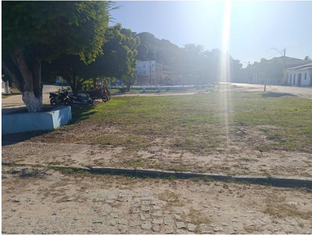
PAVIMENTAÇÃO E VEGETAÇÕES EXISTENTE.