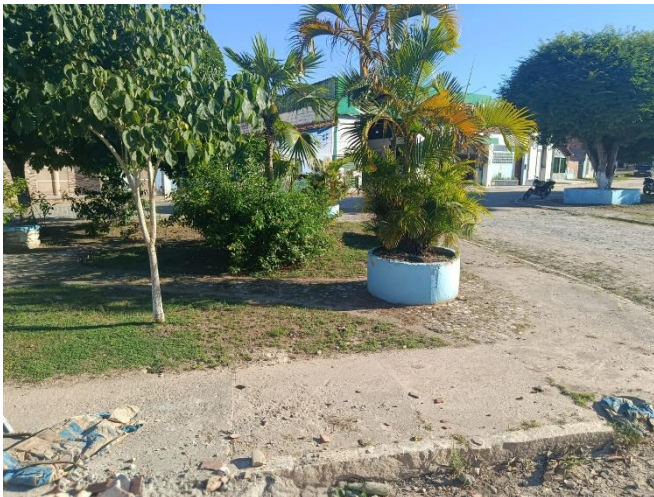
PAVIMENTAÇÃO E VEGETAÇÕES EXISTENTES.