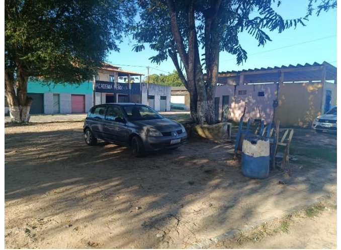
PAVIMENTAÇÃO E EDIFICAÇÕES EXISTENTES.