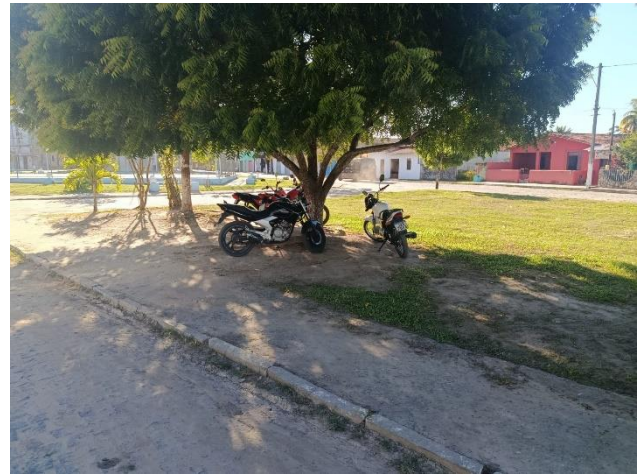
PAVIMENTAÇÃO E VEGETAÇÕES EXISTENTE.