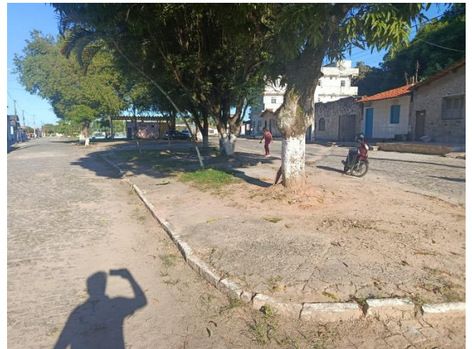
PAVIMENTAÇÃO E VEGETAÇÕES EXISTENTES.