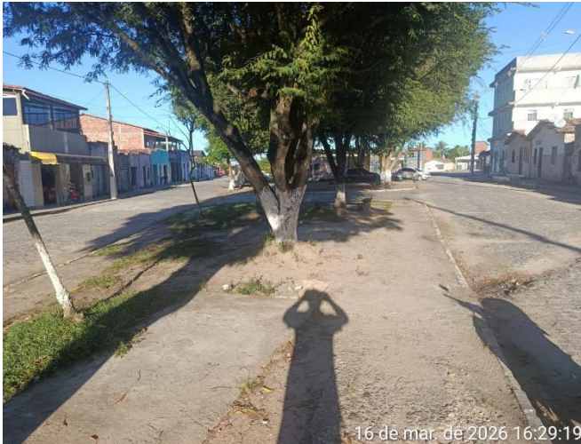
PAVIMENTAÇÃO E VEGETAÇÕES EXISTENTES.