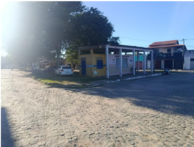
PAVIMENTAÇÃO E EDIFICAÇÕES EXISTENTES.