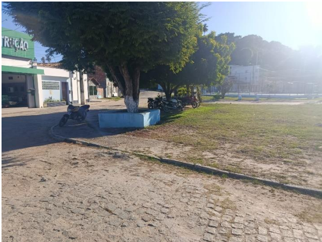
PAVIMENTAÇÃO E VEGETAÇÕES EXISTENTE.