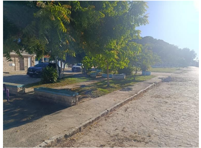
PAVIMENTAÇÃO E VEGETAÇÕES EXISTENTES.