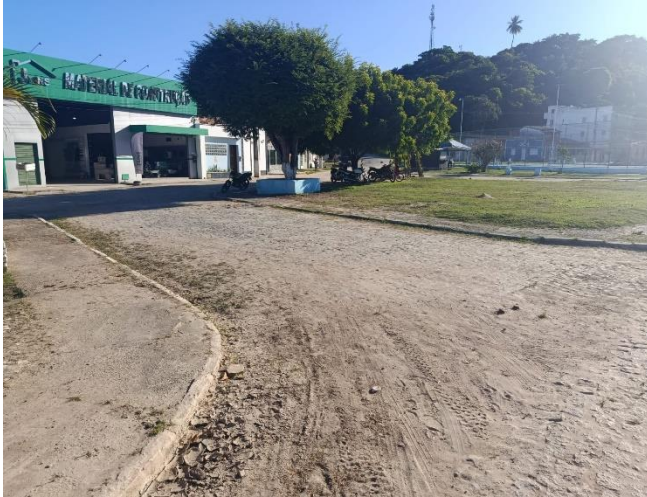
PAVIMENTAÇÃO E EDIFICAÇÃO EXISTENTES.