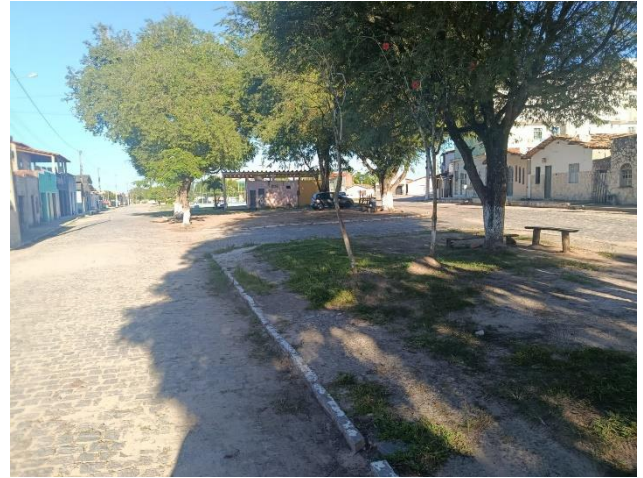
PAVIMENTAÇÃO E VEGETAÇÕES EXISTENTE.