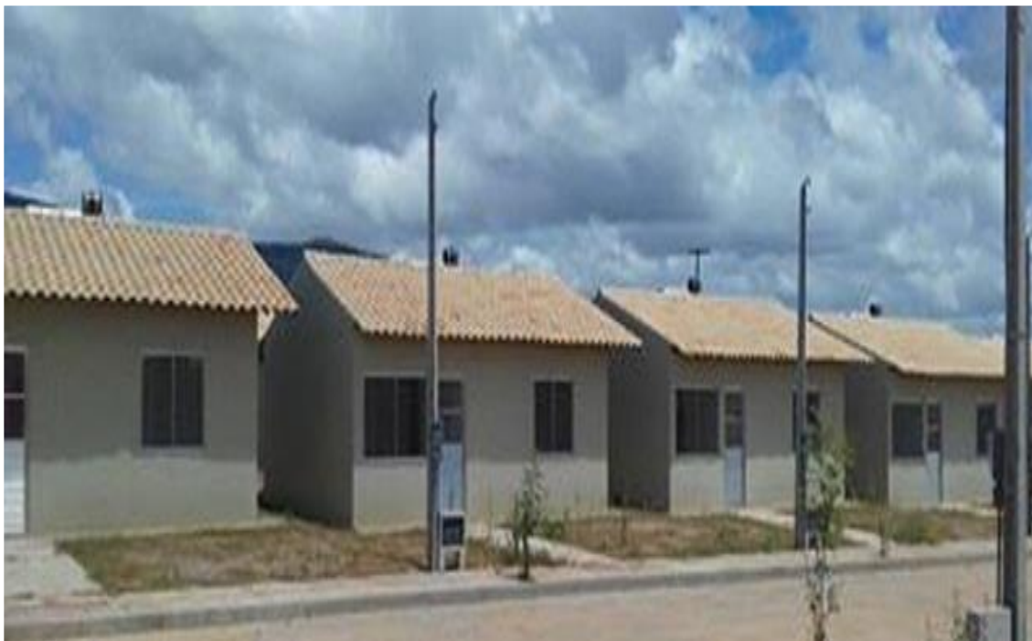
Empreendimento Residencial Segredo, Bairro Curral Novo, Jequié/Bahia

1.3. No Memorial Descritivo, anexo ao presente, constam todas as informações referentes às ações e atividades da licitação.