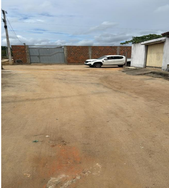
Segunda Travessa Manoel Vitor Foto 15