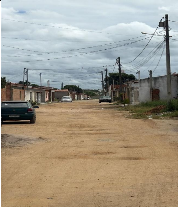
Terceira Travessa Manoel Vitor Foto 17