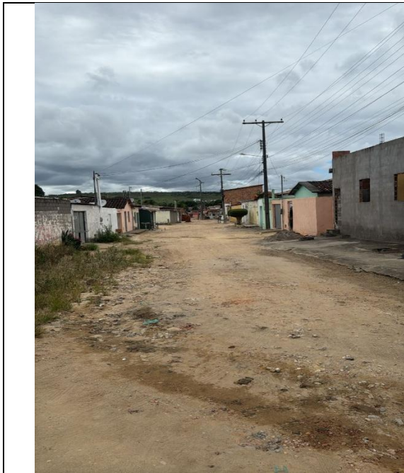
Travessa Brasil Quadrado