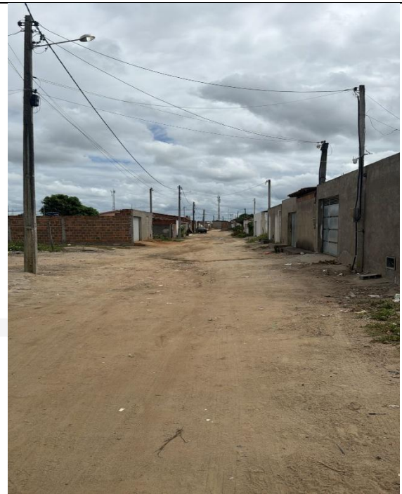
Primeira Travessa Manoel Vitor