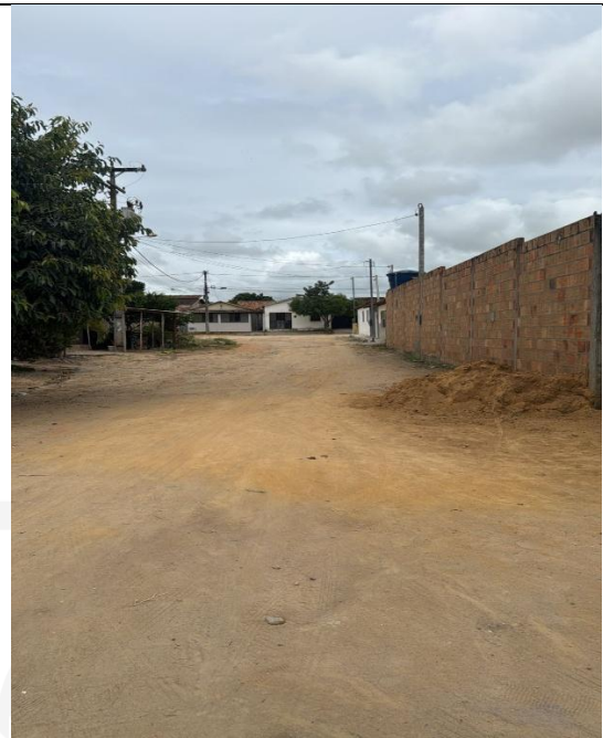
Travessa Brasil Quadrado