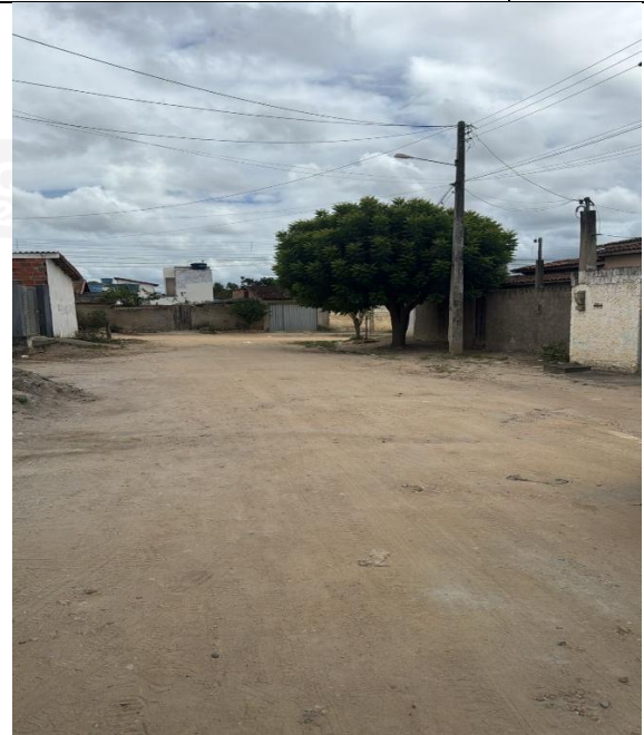
Rua Gabriel José de Souza