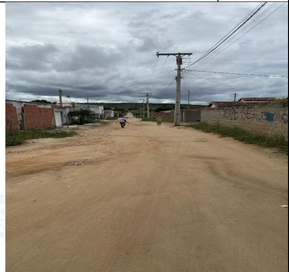
Rua Boa Esperança