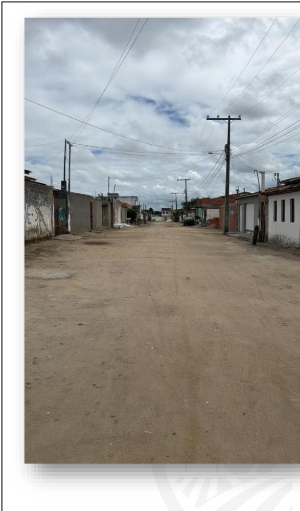
Rua Estrela do Amanhã