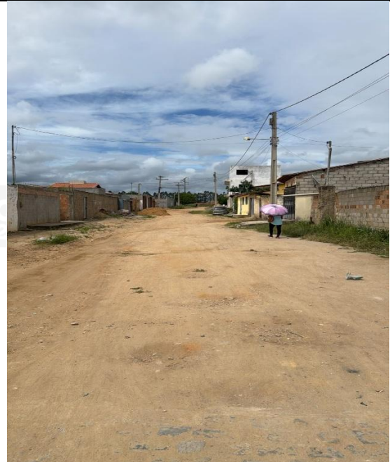
Rua Generosa Foto 18