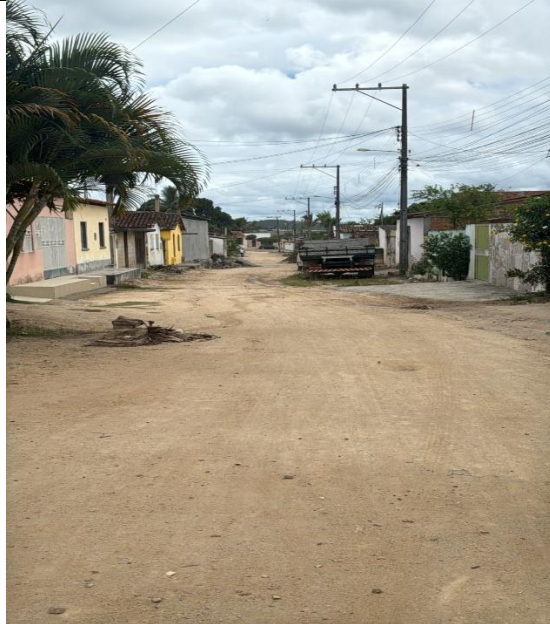
Rua Maria Cardoso Souza