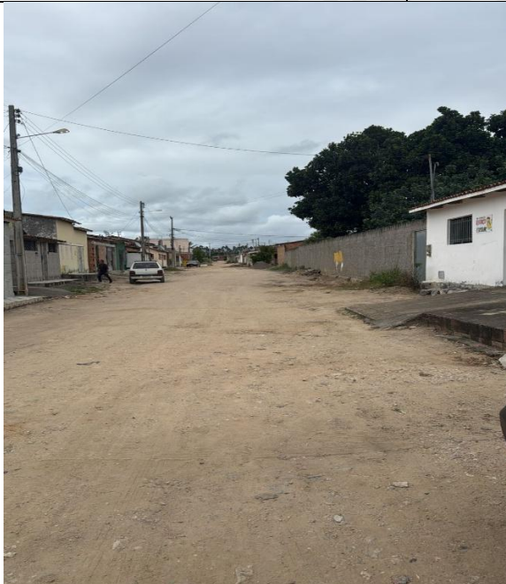
Rua Gabriel José de Souza