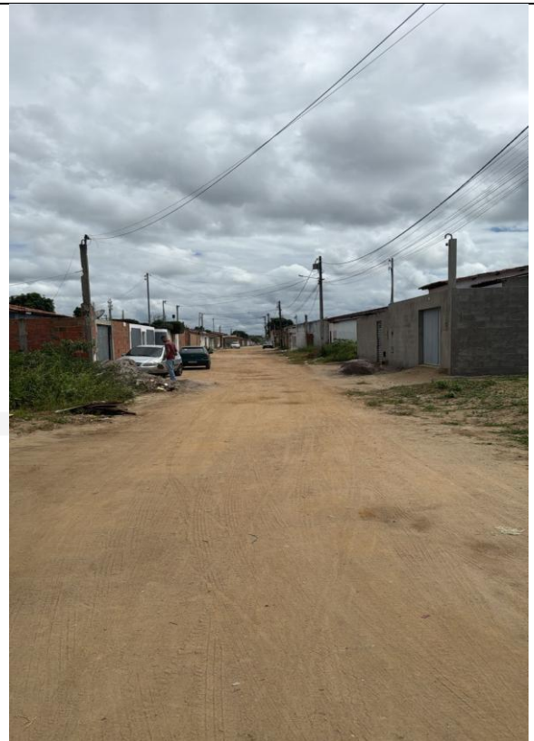
Terceira Travessa Manoel Vitor Foto 16