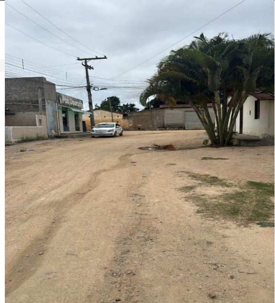
Rua Maria Cardoso Souza