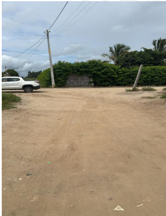
Primeira Travessa Manoel Vitor