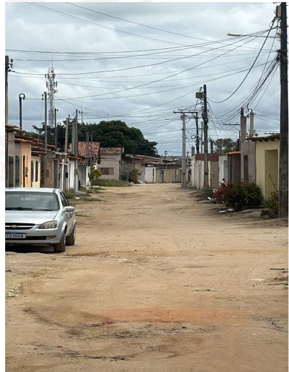
Segunda Travessa Manoel Vitor