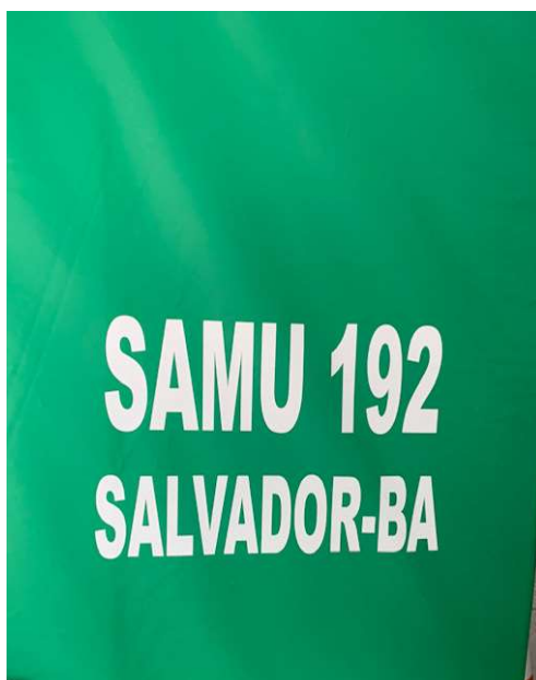
Figura 2. Impresso SAMU 192