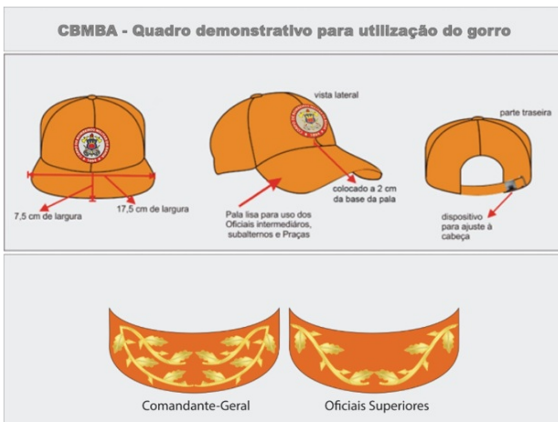
Figura 9 – Gorro – vista superior