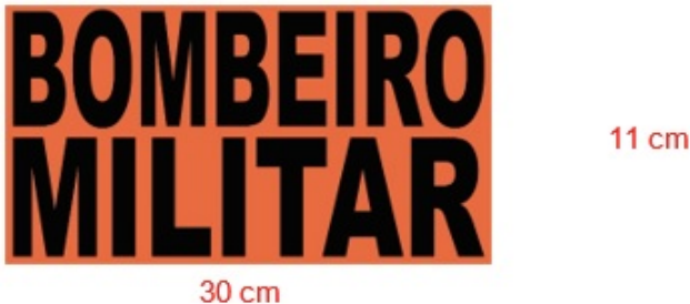
Figura 2 – Logomarca do CBMBA/dimensões

3.5.9.5. Logomarca do CBMBA em bordado na cor preta , aplicado nas costas da gandola, 03 cm abaixo da pala, com os dizeres BOMBEIRO MILITAR, em duas linhas, sendo a escrita na fonte ARIAL , tamanho 5 cm de altura, conforme descrição e dimensões da Figura 2 .