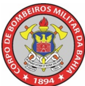
Figura 7 – Insígnia do CBMBA

3.9.3. Deverá ser mantida a dimensão padrão tanto no gorro quanto na manga da gandola.