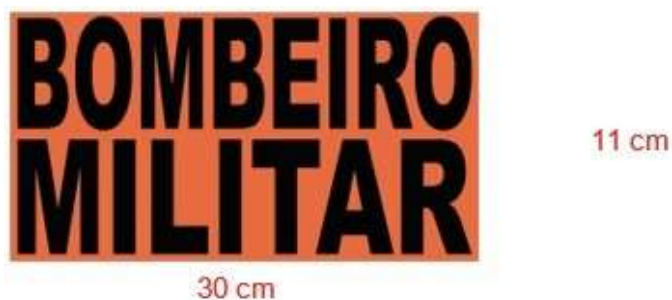
Figura 3: Ilustração logotipo costas.