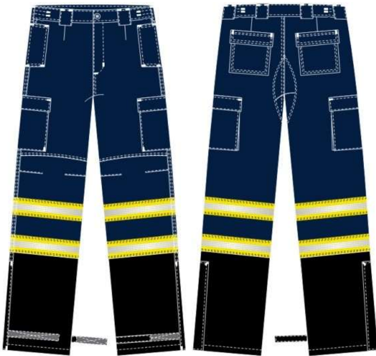
Figura 6: Ilustração da calça.