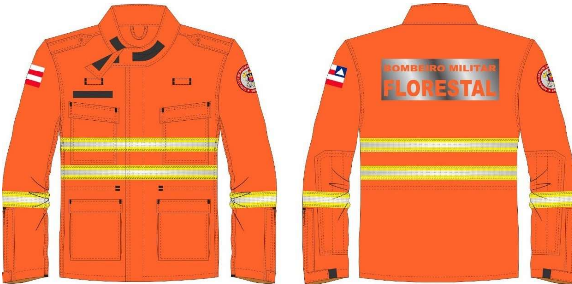
Figura 4: Ilustração do blusão.