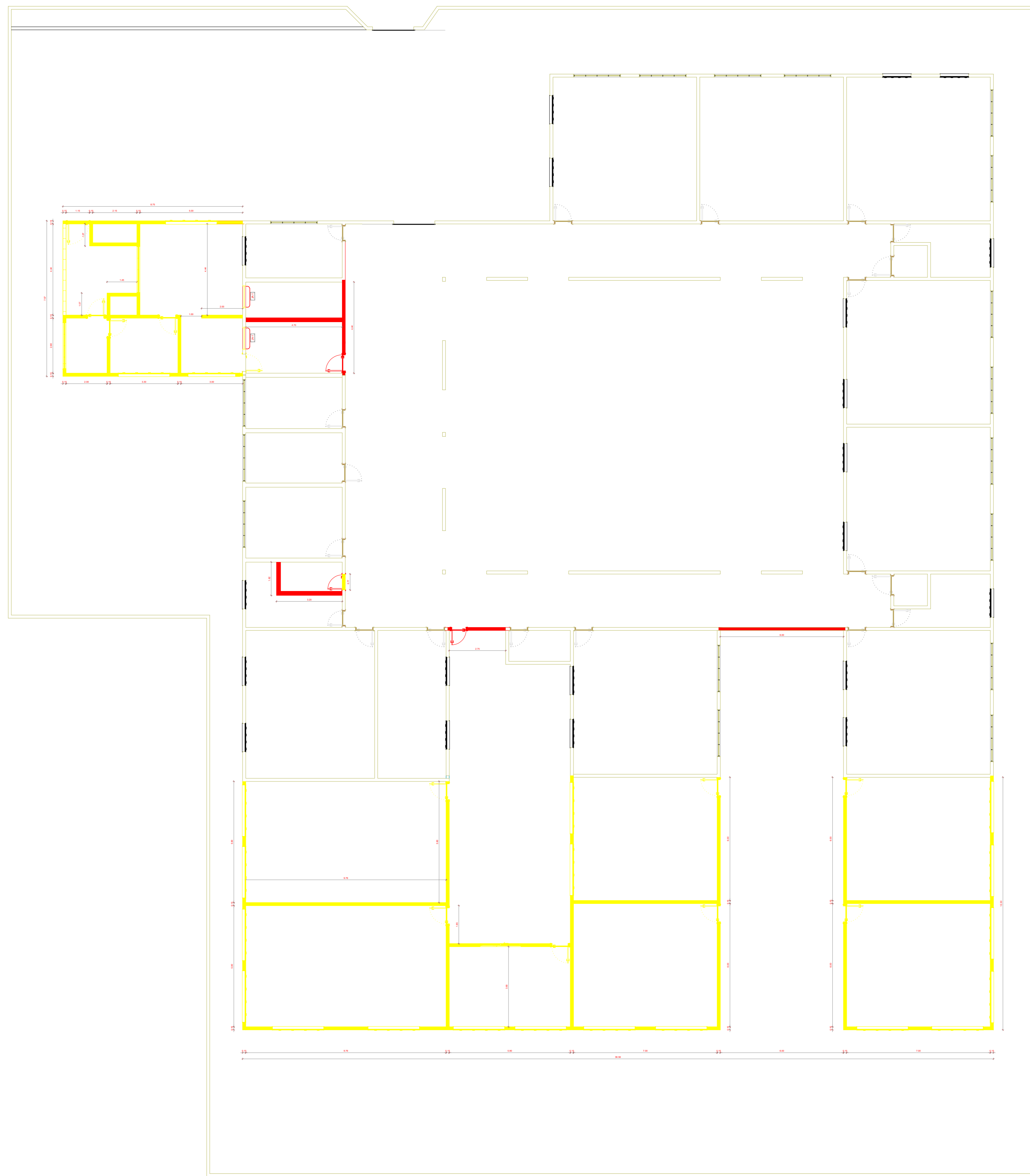
1 PLANTA BAIXA TÉRREO - REFORMA 1/50