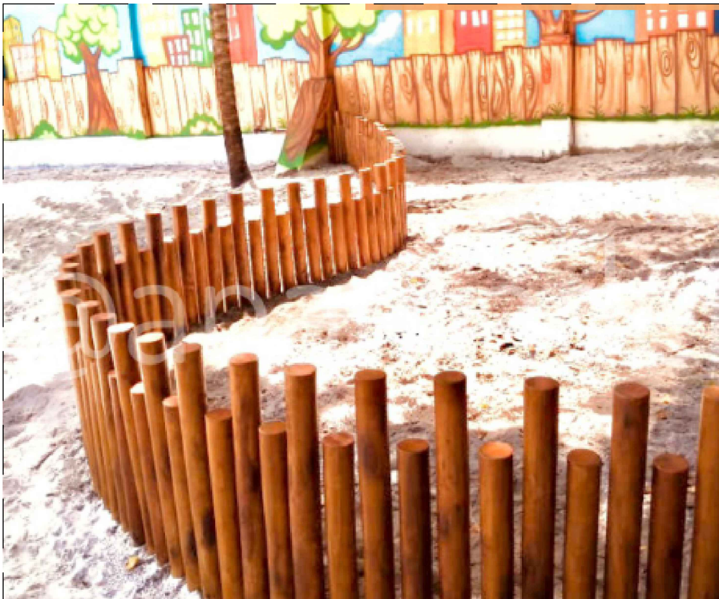
CERCADO DE MADEIRA NA VERTICAL