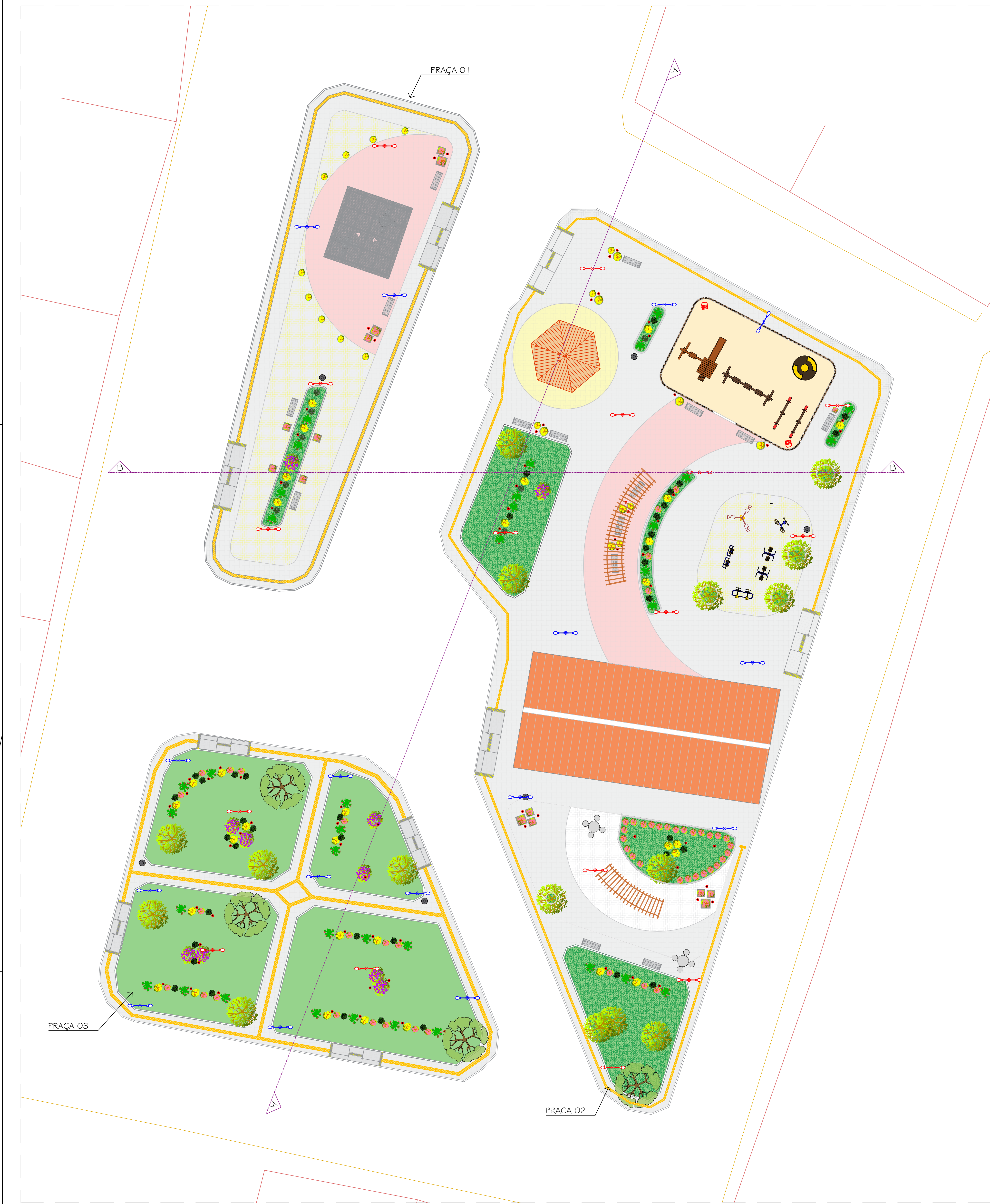
Planta Baixa - Layout ESCALA - 1:1.150