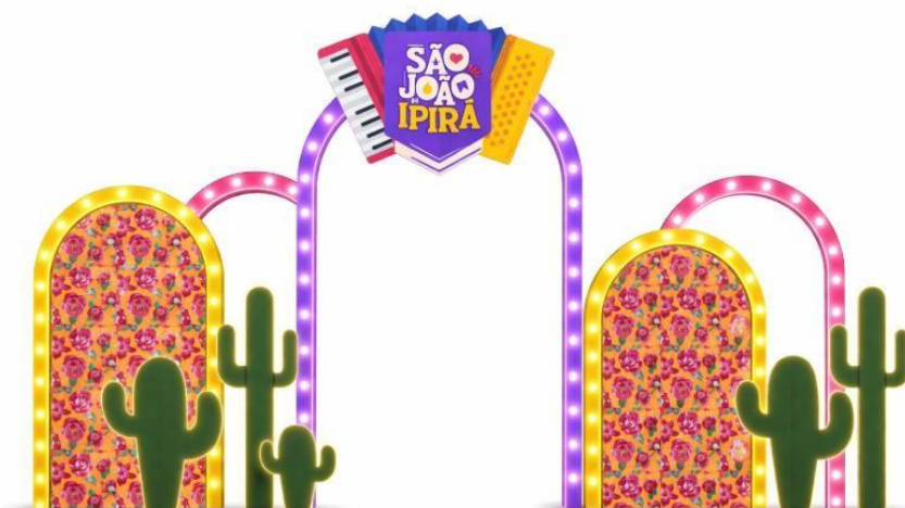
IMAGEM 11 – ESPAÇO INSTAGRAMÁVEL