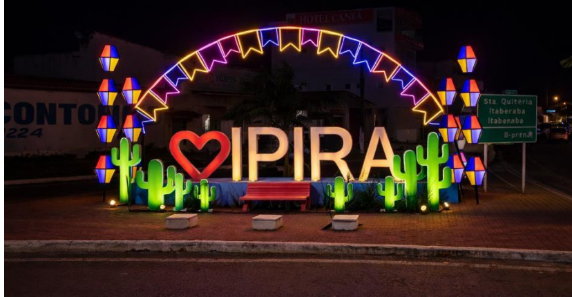
IMAGEM 02 – ENTRADA DA CIDADE