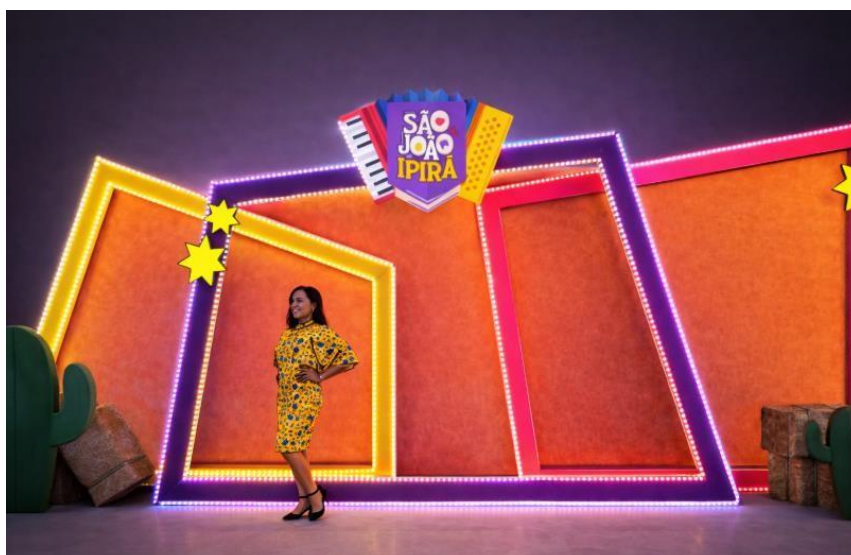
IMAGEM 12 – ESPAÇO INSTAGRAMÁVEL