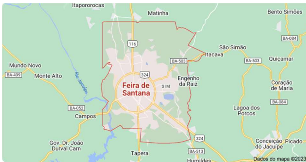
Figura 4: Mapa de Feira de Santana - Fonte: Google Maps

O PIB atual de Feira de Santana é de R$ R$ 15,15 bilhões, sendo o PIB per Capita de R$ 24.456,13 mil, o 3º maior do estado (IBGE 2020). Em relação a qualidade de vida de seus habitantes, segundo o Programa das Nações Unidas para o Desenvolvimento (PNUD 2010), a cidade conta com um IDH de 0,712 sendo o 5º melhor índice da Bahia.