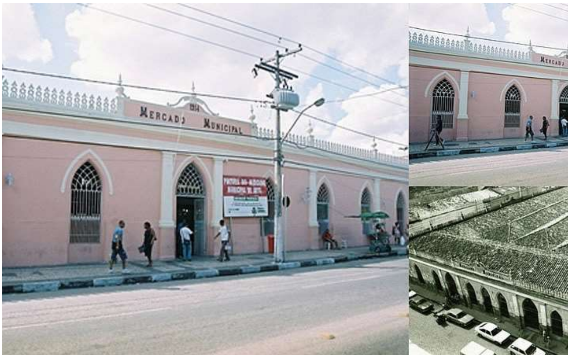
Figura 9: Mercado Municipal.

O Mercado Municipal um espaço cultural de comércio, com grande propagação da cultura local e venda de artefatos regionais. Sendo assim, uma grande variedade de produtos é comercializada no mercado municipal, inclusive elementos da culinária local e artesanatos. Além disso, o mercado municipal também é ponto de apresentação ao vivo de artistas, como cordelistas. O nome oficial do mercado se tornou Mercado de Arte Popular, tamanha sua representatividade.