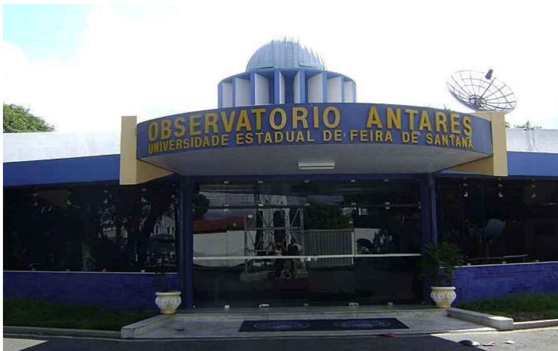
Figura 10: Observatório Astronômico Antares.

O Observatório Astronômico Antares tem uma grande importância de pesquisa, sendo também ele vinculado a Universidade Estadual de Feira de Santana. Todavia, a visita ao público é aberta e, também muito interessante. Assim, é possível assistir palestras, fazer cursos, fazer observações especiais e até mesmo utilizar o acervo local, como o da biblioteca.