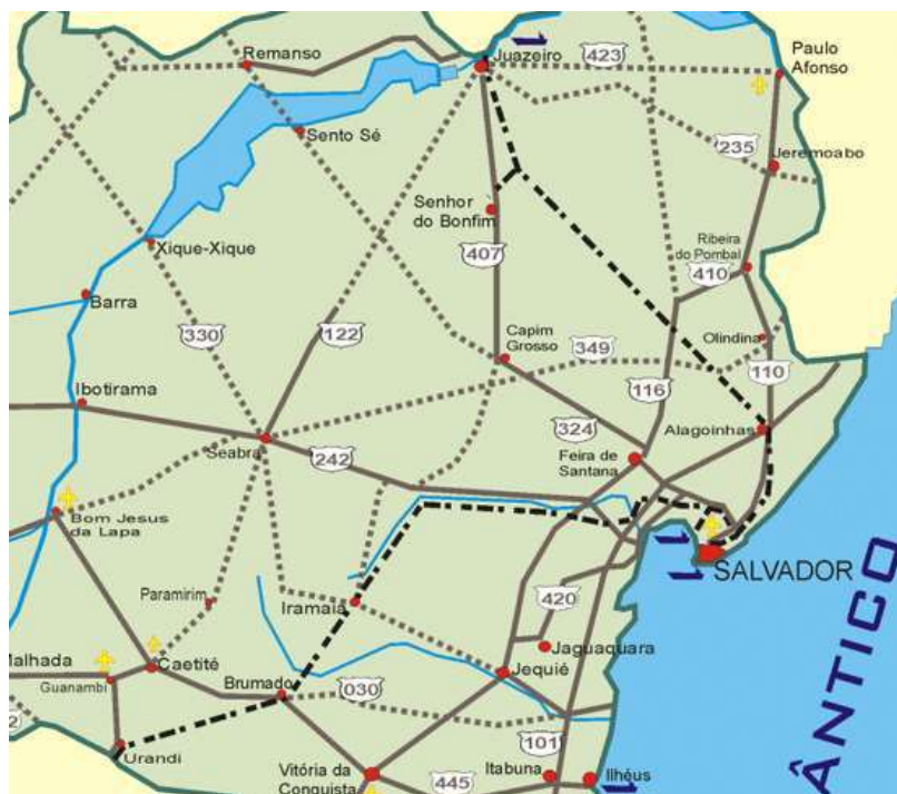
Figura 3: Rodovias que cortam o município.

O município é interceptado por sete rodovias: quatro rodovias a nível estadual (BA-502, BA-503, BA-504 e BA-052) e três a nível federal (BR-101, BR-116 e BR-324). Esta última, faz a ligação com Salvador, sendo a mais importante e movimentada, tal rodovia foi essencial para o crescimento urbano e regional de Feira de Santana.