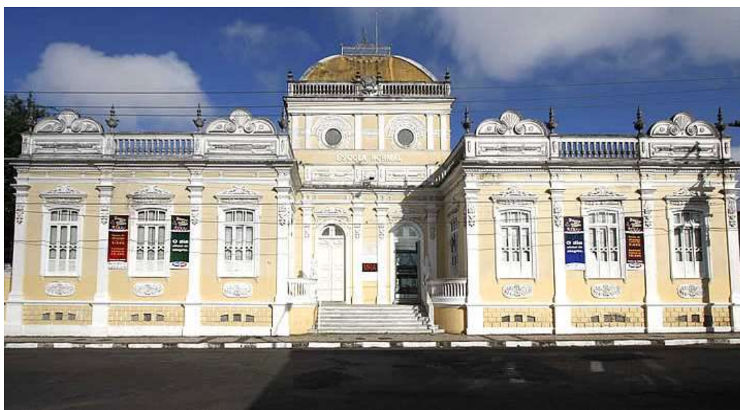
Figura 8: Museu Regional de Arte.

O Museu Regional de Arte (também chamado de MRA) foi o primeiro museu a ser instalado em Feira de Santana, em 1967. Apesar de hoje Feira de Santana já ter outros museus, ele ainda é um dos mais importantes da cidade – e até mesmo do estado. Isso porque seu acervo é especialmente de artes visuais, com coleções de artistas importantes brasileiros e internacionais. O museu é vinculado a Universidade Estadual de Feira de Santana.