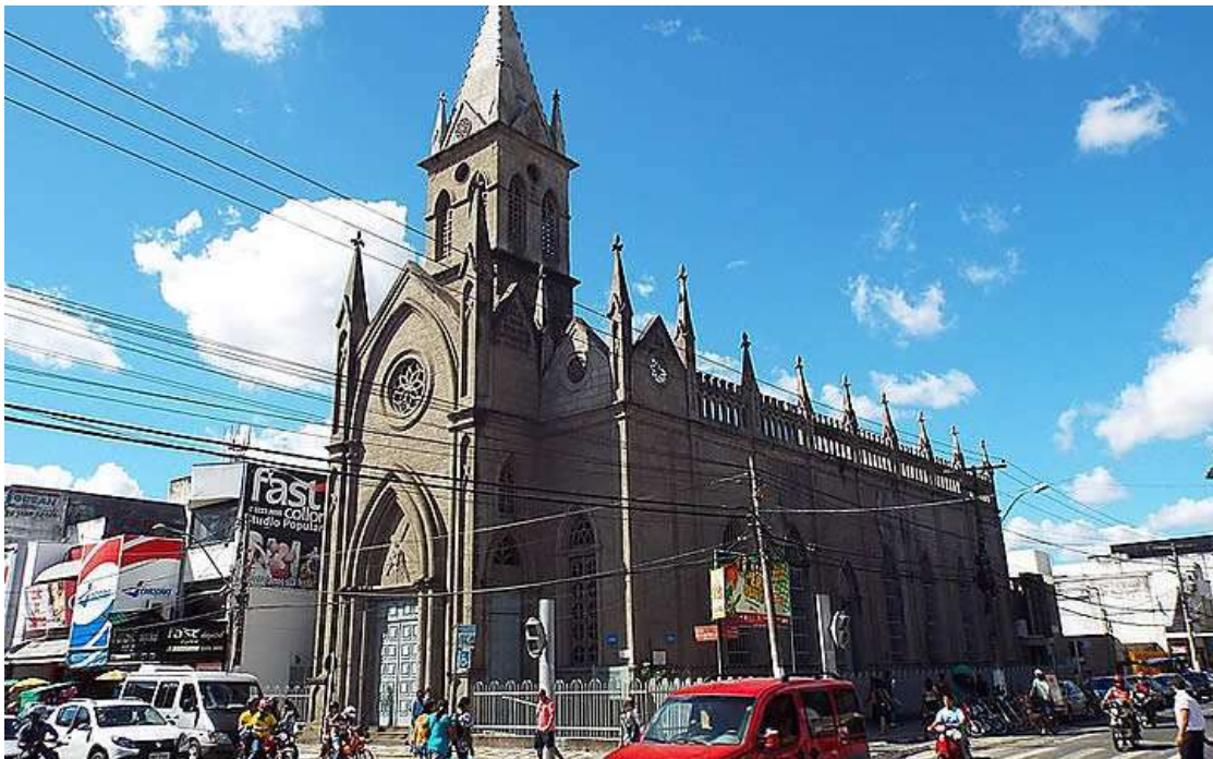
Figura 7: Igreja Senhor dos Passos.

A Igreja Senhor dos Passos foi fundada em 1852, quando era apenas uma capela. Ela passou por modificações, demolições e desgaste do tempo. Foi só em 1936 que a Igreja em seu formato atual foi entregue, apesar das obras de reconstrução não estarem totalmente terminadas. Sua inauguração oficial foi oficialmente em 1979, na noite de Natal.