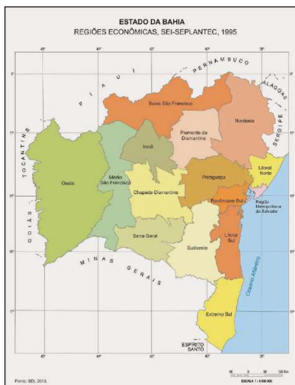
Figura 2: Regiões Econômicas da Bahia.