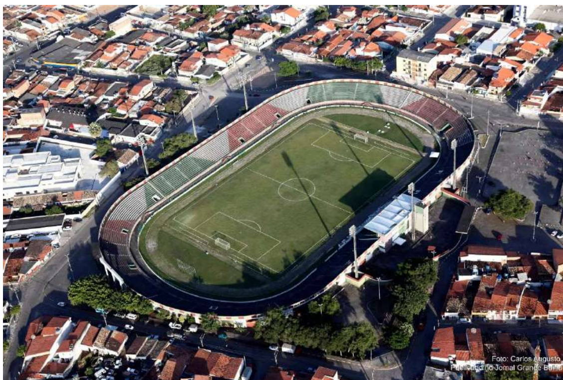
Figura 1: Estádio Joia da Princesa.

A “Princesa do Sertão”, como é conhecida Feira de Santana, foi oficialmente fundada em 16 de julho de 1873, mas suas origens remontam do século XVII, período em que se deu o povoamento por ser o local, parada obrigatória, no caminho utilizado para o transporte do gado. Próximo às lagoas instalou-se uma feira, embrião da cidade em destaque.