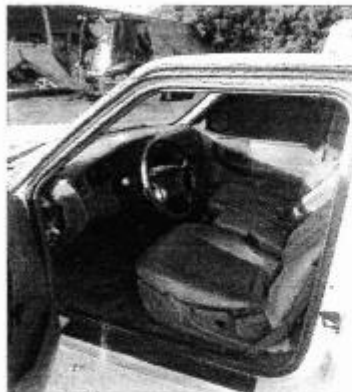
Caminhonete Ford Ranger ano 2008