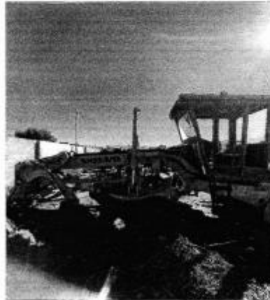
Patrol Mononiveladora Volvo