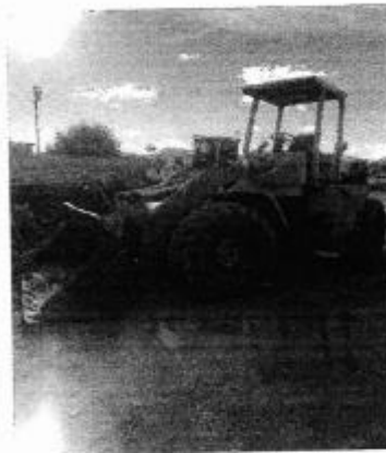
Pá Carregadeira Enchedeira