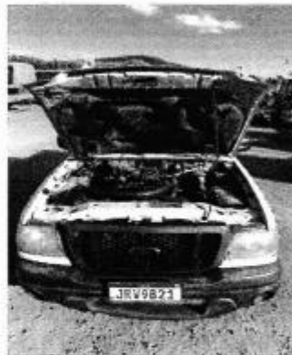
Caminhonete Ford Ranger ano 2008