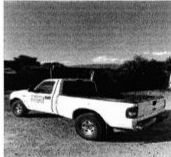
Caminhonete Ford Ranger ano 2008