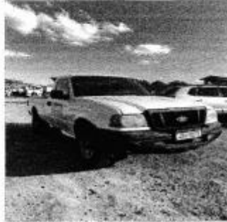
Caminhonete Ford Ranger ano 2008