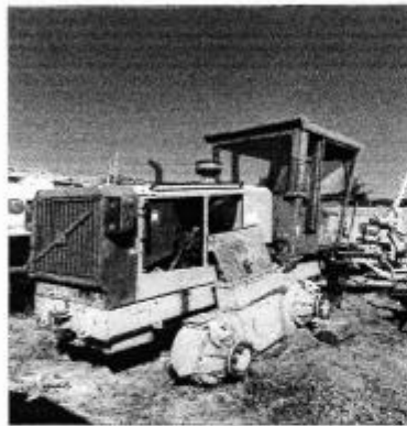
Patrol Mononiveladora Volvo

ESTADO DA BAHIA PREFEITURA MUNICIPAL DE ITUAÇU Pça. Gilberto Gil, s/n – CNPJ 14.106.280/0001-21 Cep: 46640-000 Telefax: (77) 3415-2418 e-mail – pmituacu@hotmail.com