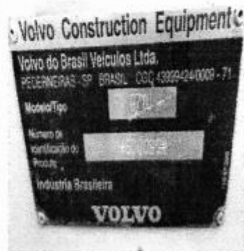
Patrol Mononiveladora Volvo