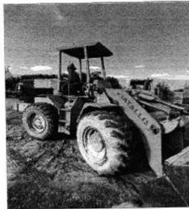
Pá Carregadeira Enchedeira