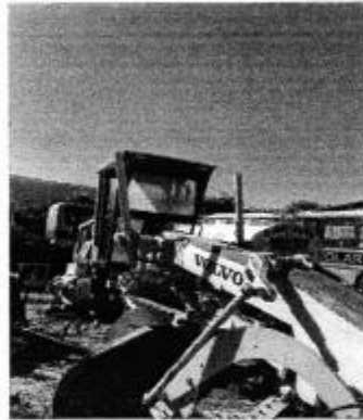
Patrol Mononiveladora Volvo