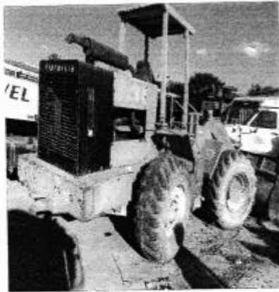
Pá Carregadeira Enchedeira

ESTADO DA BAHIA PREFEITURA MUNICIPAL DE ITUAÇU Pça. Gilberto Gil, s/n – CNPJ 14.106.280/0001-21 Cep: 46640-000 Telefax: (77) 3415-2418 e-mail – pmituacu@hotmail.com