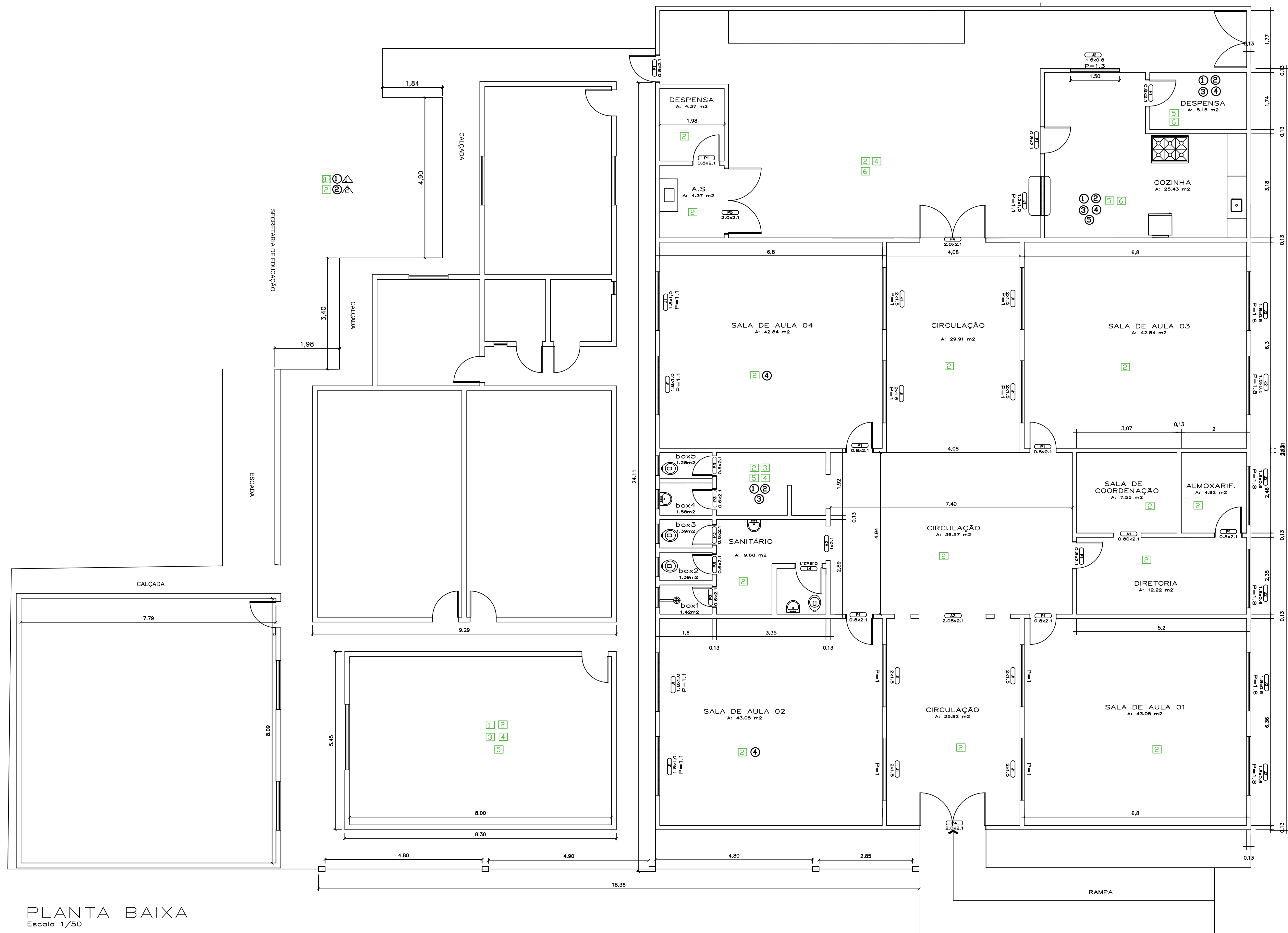
PLANTA BAIXA Escala 1/50