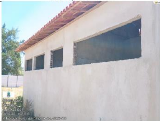
FOTO 09- FUNDOS SEM ACABAMENTO, SEM REQUADRAÇÃO SEM ACABAMENTO NO TELHADO, SEM COBOGO.