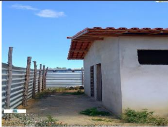
FOTO 07- LATERAL DIREITA SEM ACABAMENTO, SEM PORTAS, SEM COBOGO