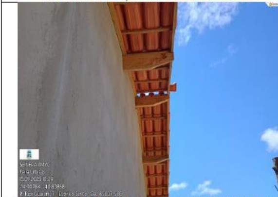
FOTO 17 - TELHADO DANIFICADO, SEM ACABAMENTO, EMPENA SEM ACABAMENTO.