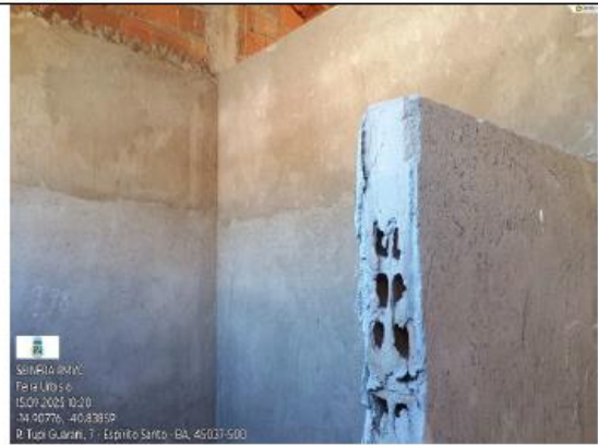
FOTO 14 - INTERIOR DO SANITARIO SEM REQUADRAÇÕES, SEM ACABAMENTO .