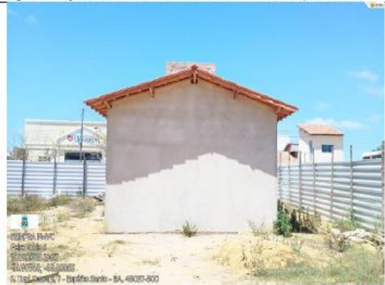
FOTO 12- LATERAL ESQUERDA SEM ACABAMENTO, SEM REQUADRAÇÃO SEM ACABAMENTO NO TELHADO.