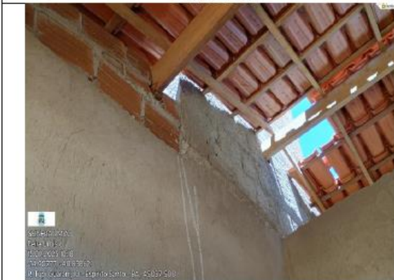
FOTO 15 - INTERIOR DO SANITARIO TELHADO DANIFICADO, SEM ACABAMENTO, EMPENA SEM ACABAMENTO.