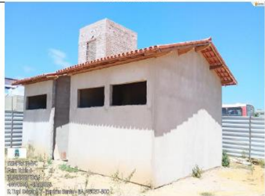
FOTO 10- LATERAL ESQUERDA SEM ACABAMENTO, SEM REQUADRAÇÃO SEM ACABAMENTO NO TELHADO, SEM COBOGO.