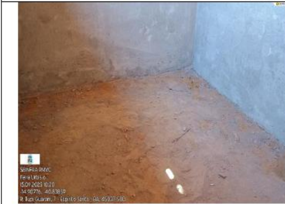
FOTO 13- INTERIOR DO SANITARIO SEM ACABAMENTO, SEM CONTRAPISO.