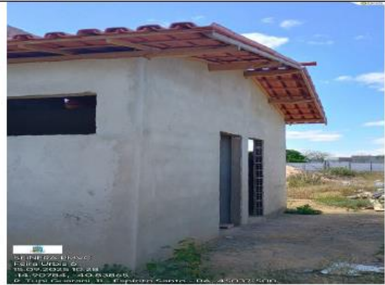
FOTO 08- LATERAL DIREITA SEM ACABAMENTO, SEM PORTAS, SEM COBOGO