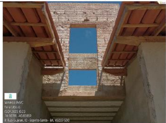
FOTO 16- TORRE CENTRAL SEM APLICAÇÃO DE MASSA ÚNICA, LATERAL E LAJE, SEM PORTA, SEM COBO, SEM TELHADO.