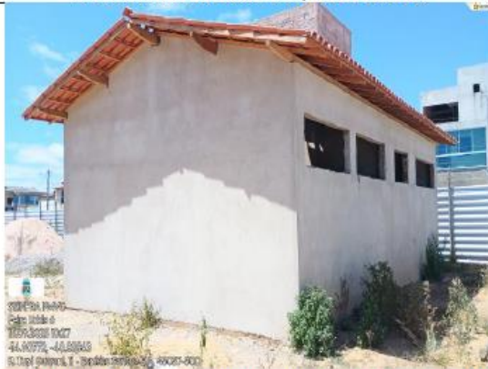
FOTO 11- LATERAL ESQUERDA SEM ACABAMENTO, SEM REQUADRAÇÃO SEM ACABAMENTO NO TELHADO, SEM COBOGO.