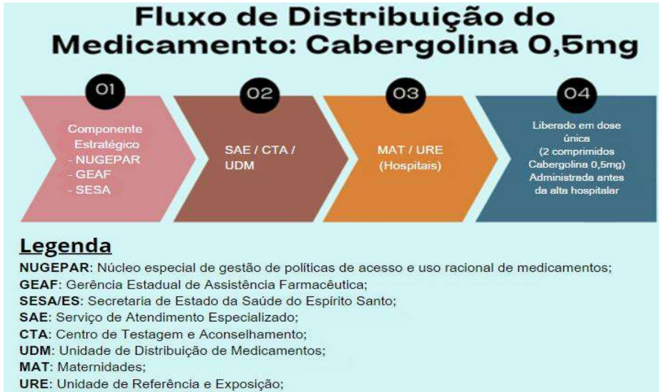
Figura 2. Fluxo de distribuição do medicamento: cabergolina 0,5 mg

O medicamento cabergolina 0,5 mg, padronizado para uso em gestantes portadoras do HTLV, é financiado e fornecido pelo Governo do Estado do Espírito Santo, conforme acordado em Resolução CIB nº 241, de 23/11/2017 e compõe a lista estadual complementar da Relação Estadual de medicamentos.