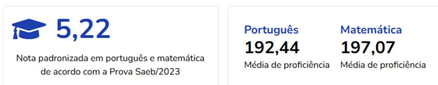
Evolução nota Saeb

De modo geral, o diagnóstico educacional de Itaberaba aponta para três grandes dimensões de análise: