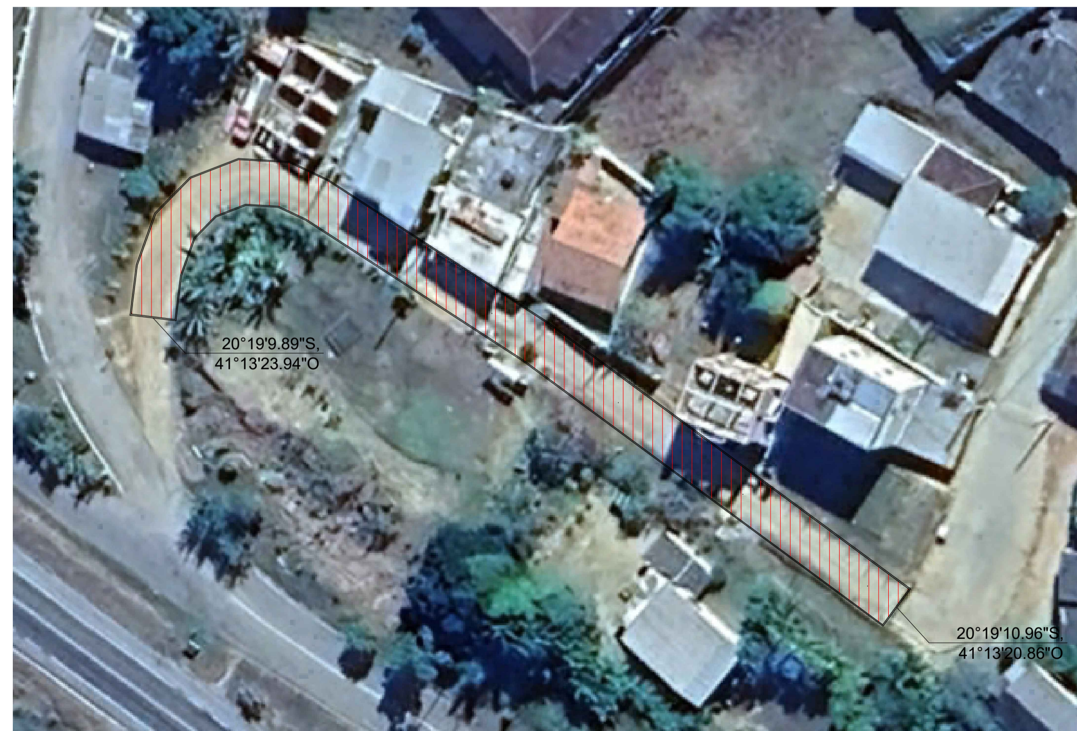
VISTA AEREA DA ÁREA QUE SERÁ PAVIMENTADA NA COMUNIDADE DO INDAIÁ ESCALA: 1/500