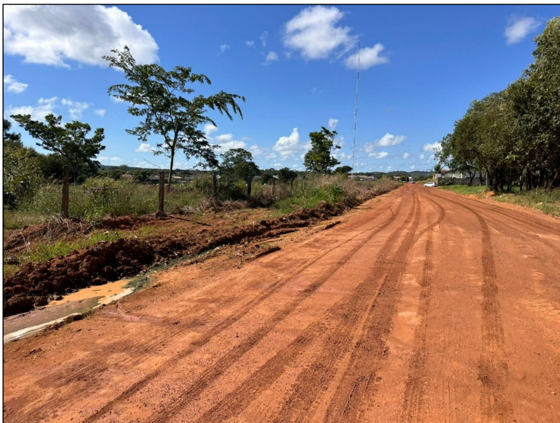
Figura 10 – FOTO EIXO VIA