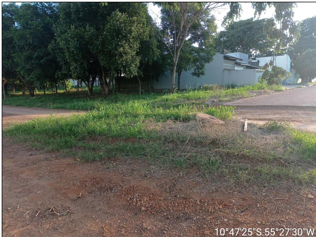
Figura 2 – FOTO EIXO VIA- INTERFERÊNCIA DE PV ESGOTO