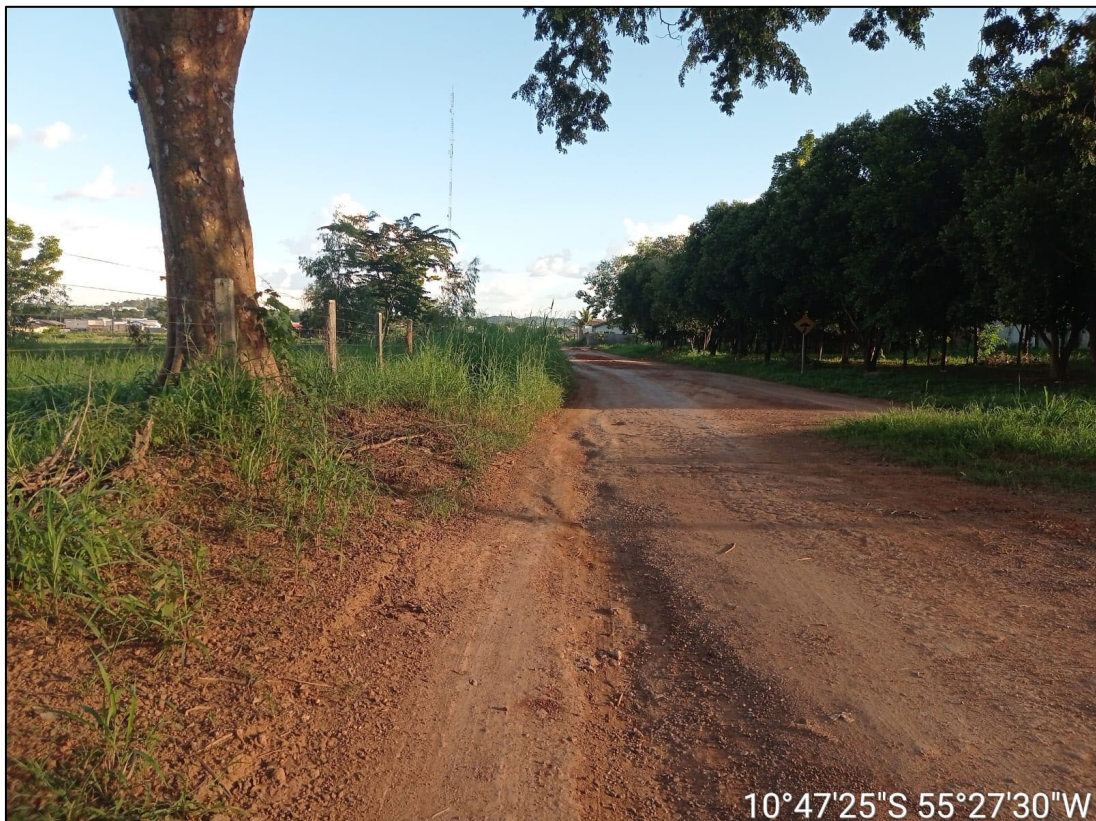
Figura 10 - FOTO BORDO DA PISTA