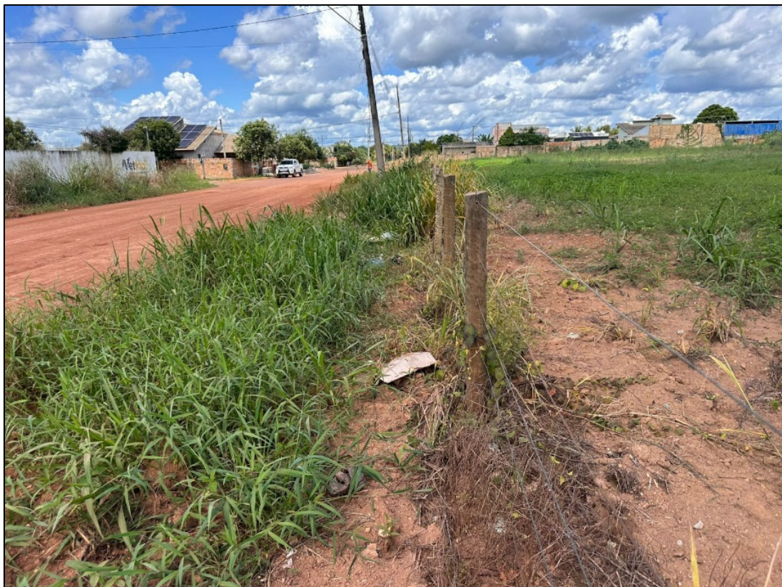
Figura 8 – FOTO BORDO DA PISTA