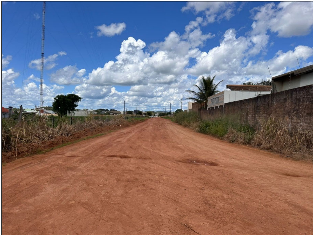
Figura 14 – FOTO EIXO DA VIA