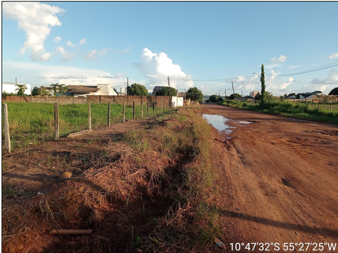
Figura 9 – FOTO BORDO DA PISTA