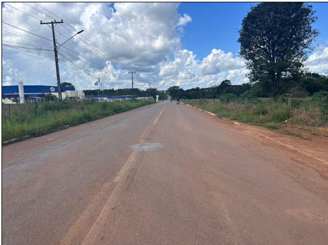
Figura 172 - FOTO DO FINAL DA PISTA COM AV. JÚLIO DOMINGOS DE CAMPOS