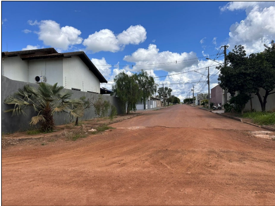
Figura 7 – PRIMEIRA ESQUINA COM ASFALTO