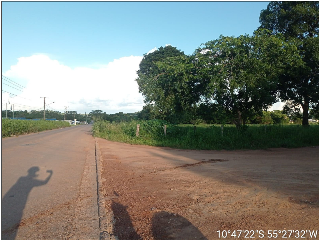
Figura 71 – FOTO DO FINAL DA PISTA COM AV. JÚLIO DOMINGOS DE CAMPOS