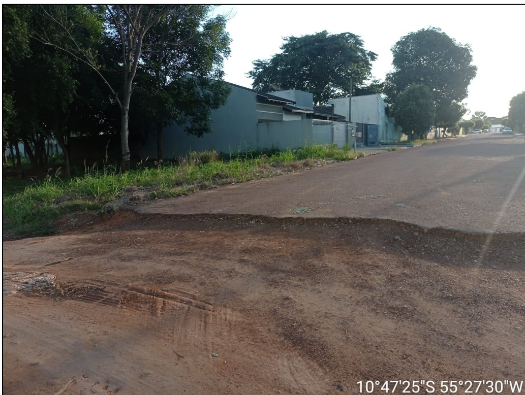
Figura 4 – FOTO DA SEGUNDA ESQUINA COM ASFALTO