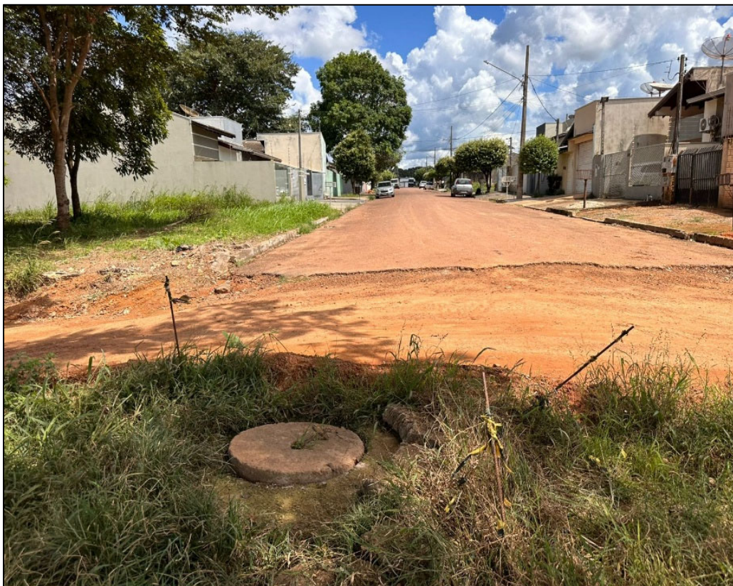
Figura 13 – FOTO DA SEGUNDA ESQUINA COM ASFALTO