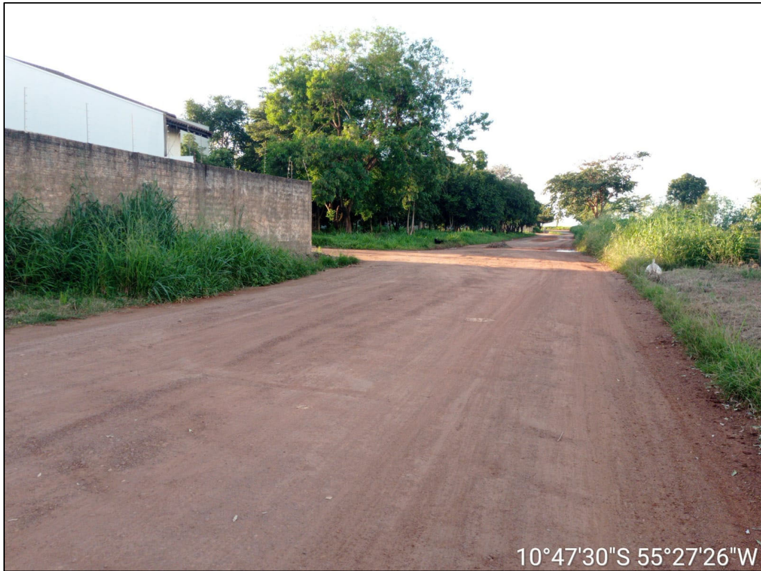
Figura 5 – FOTO EIXO DA VIA