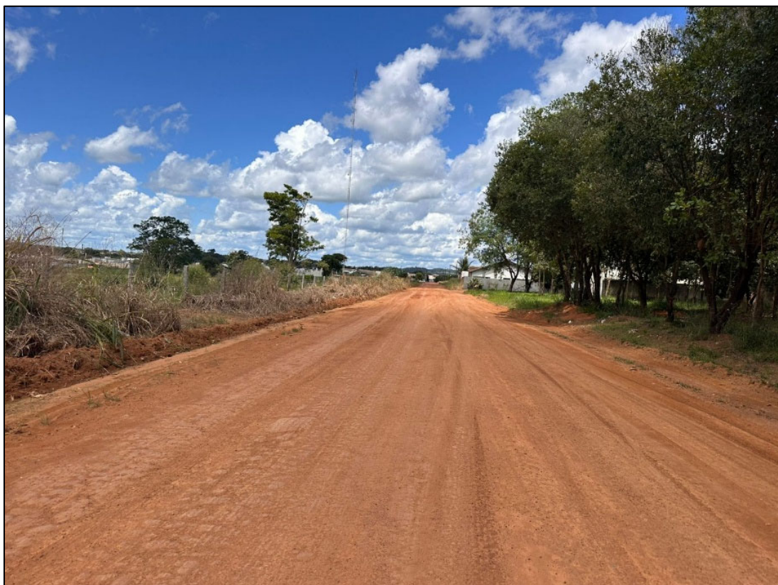
Figura 15 – FOTO EIXO DA VIA