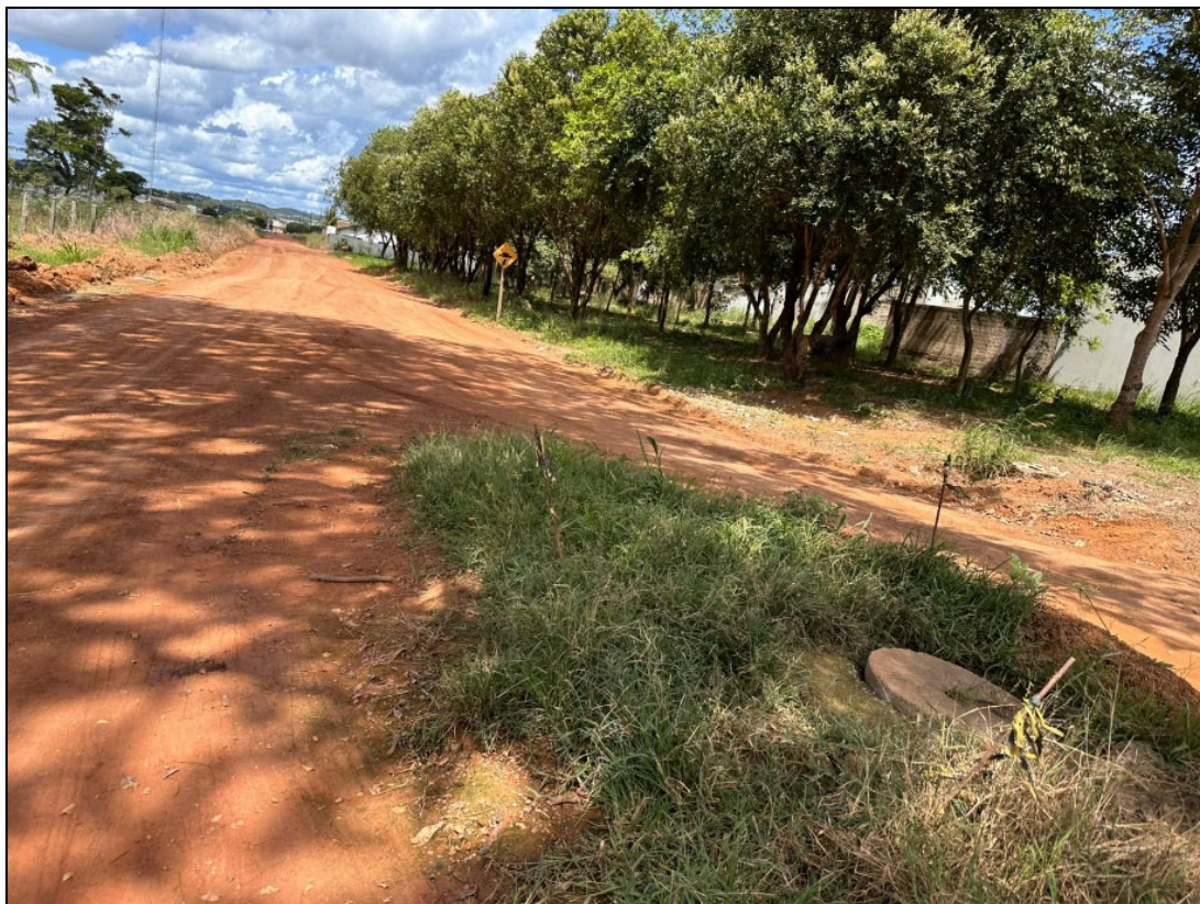
Figura 11 – FOTO EIXO VIA- INTERFERÊNCIA DE PV ESGOTO