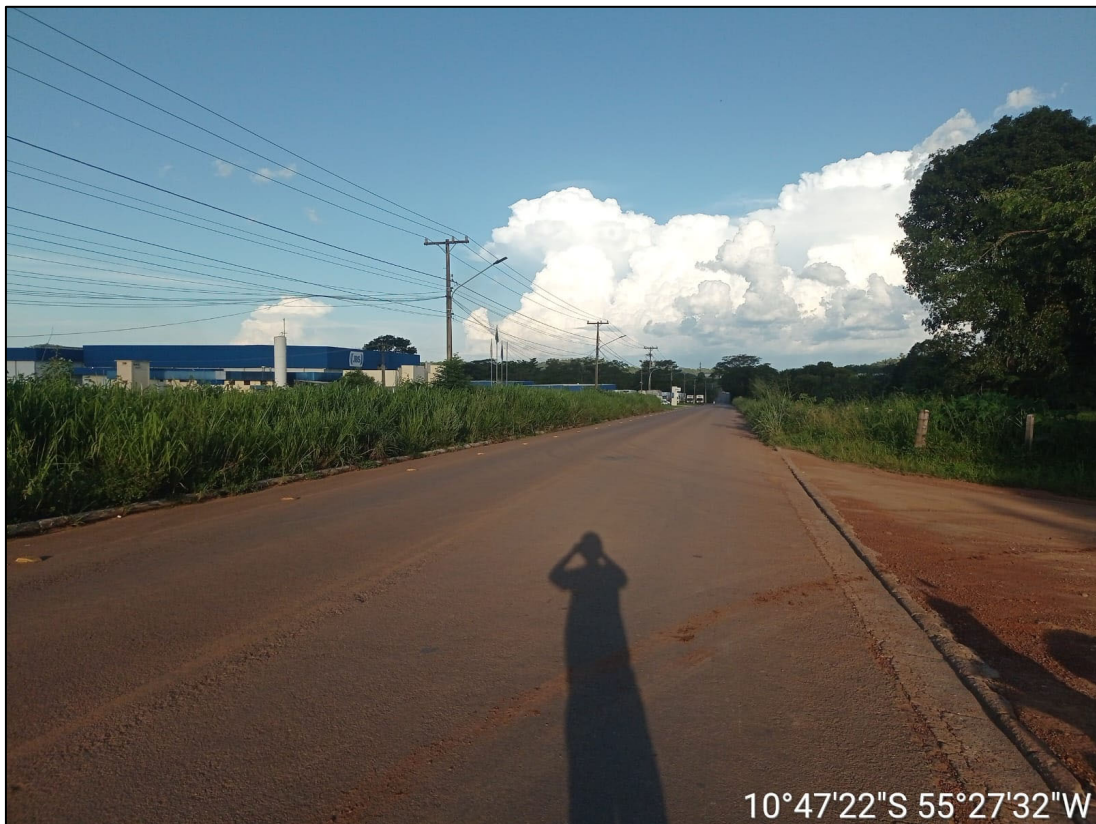
Figura 82 - FOTO DO FINAL DA PISTA COM AV. JÚLIO DOMINGOS DE CAMPOS