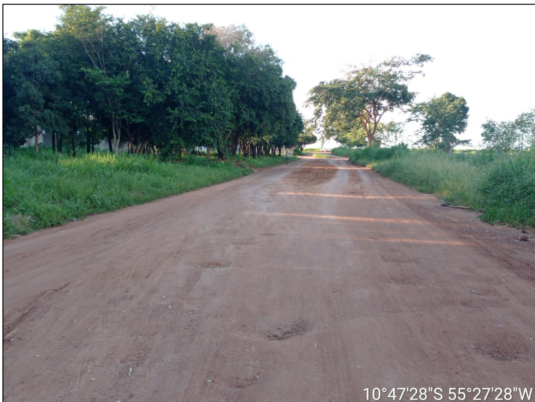
Figura 6 – FOTO EIXO DA VIA