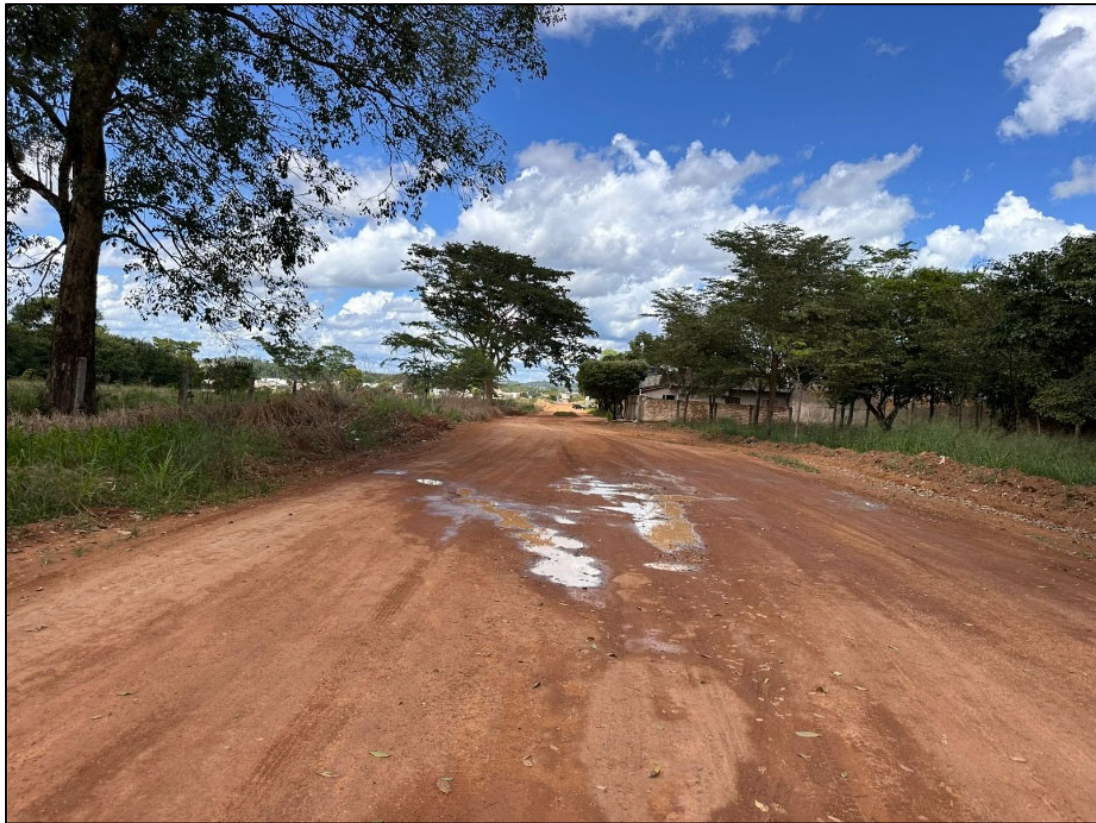
Figura 12 - FOTO EIXO VIA