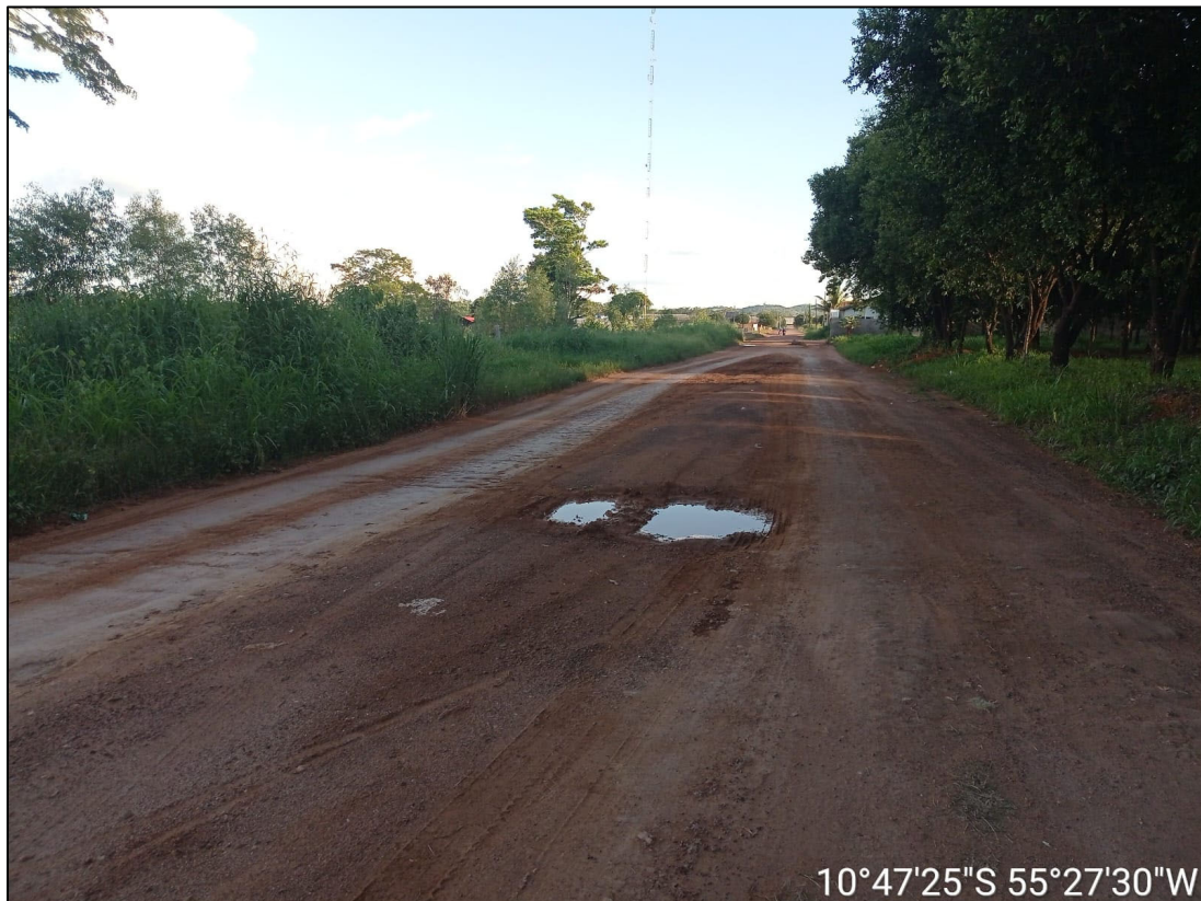
Figura 1 – FOTO EIXO VIA