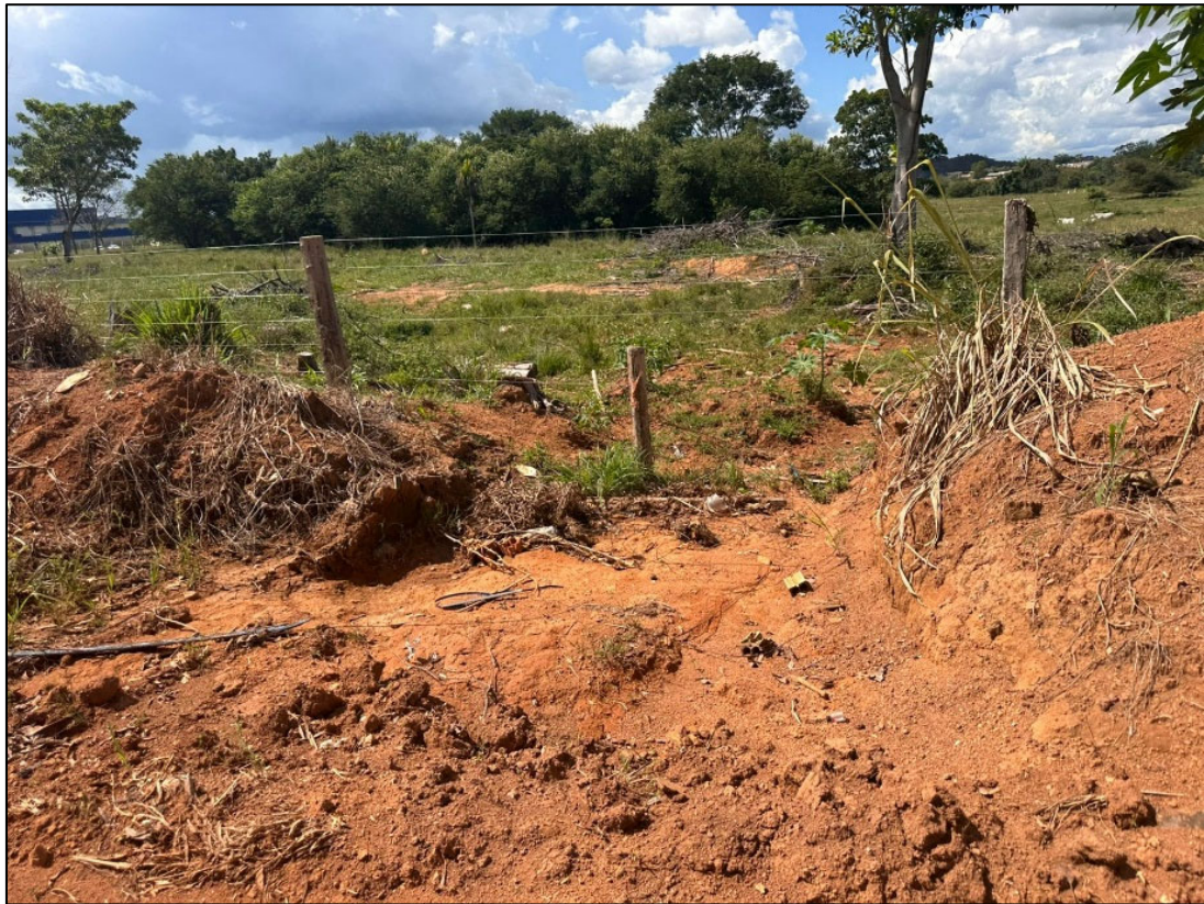
Figura 183 – FOTO BORDO DA PISTA- SAÍDA DE ÁGUA