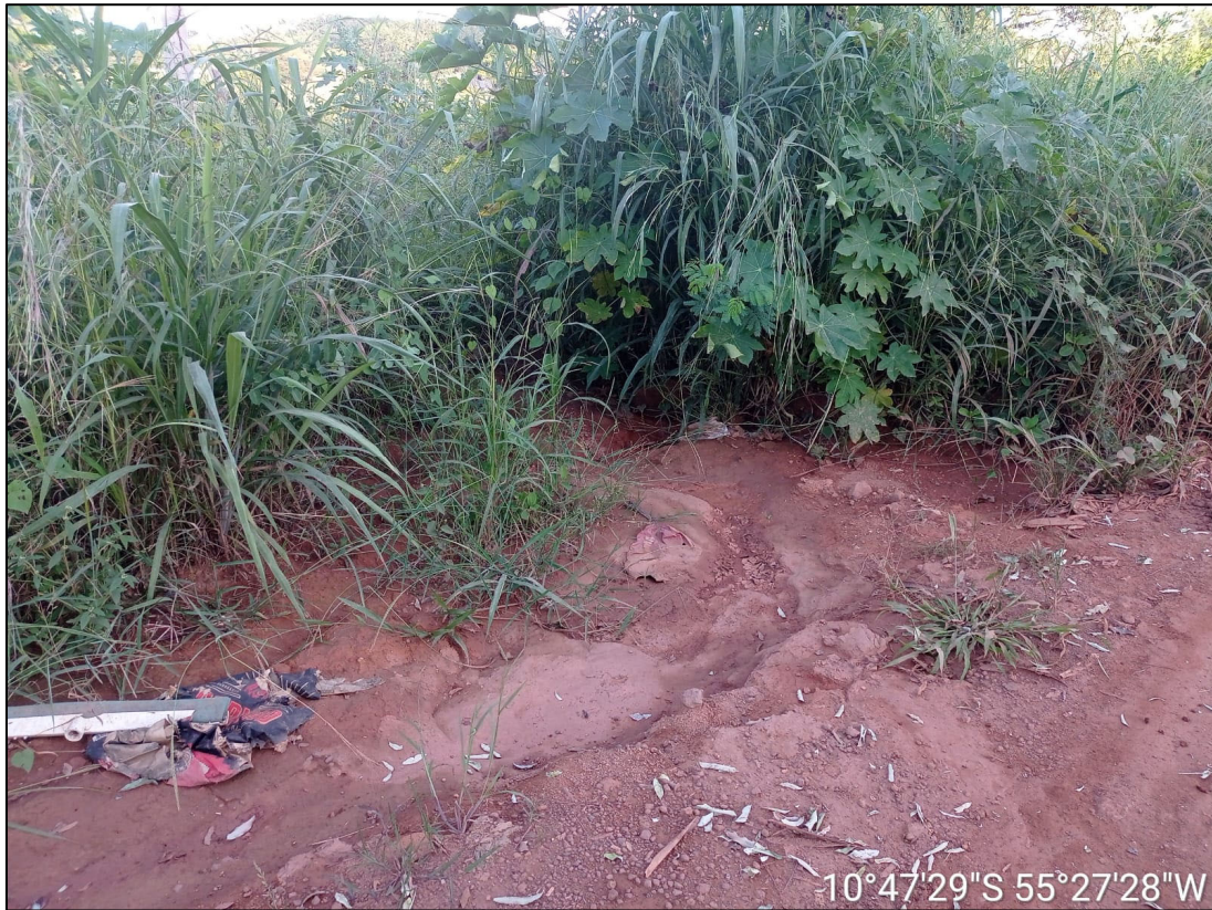
Figura 93 – FOTO BORDO DA PISTA- SAÍDA DE ÁGUA