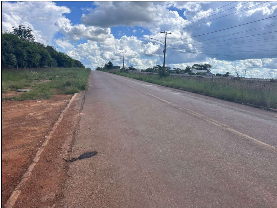
Figura 161 – FOTO DO FINAL DA PISTA COM AV. JÚLIO DOMINGOS DE CAMPOS