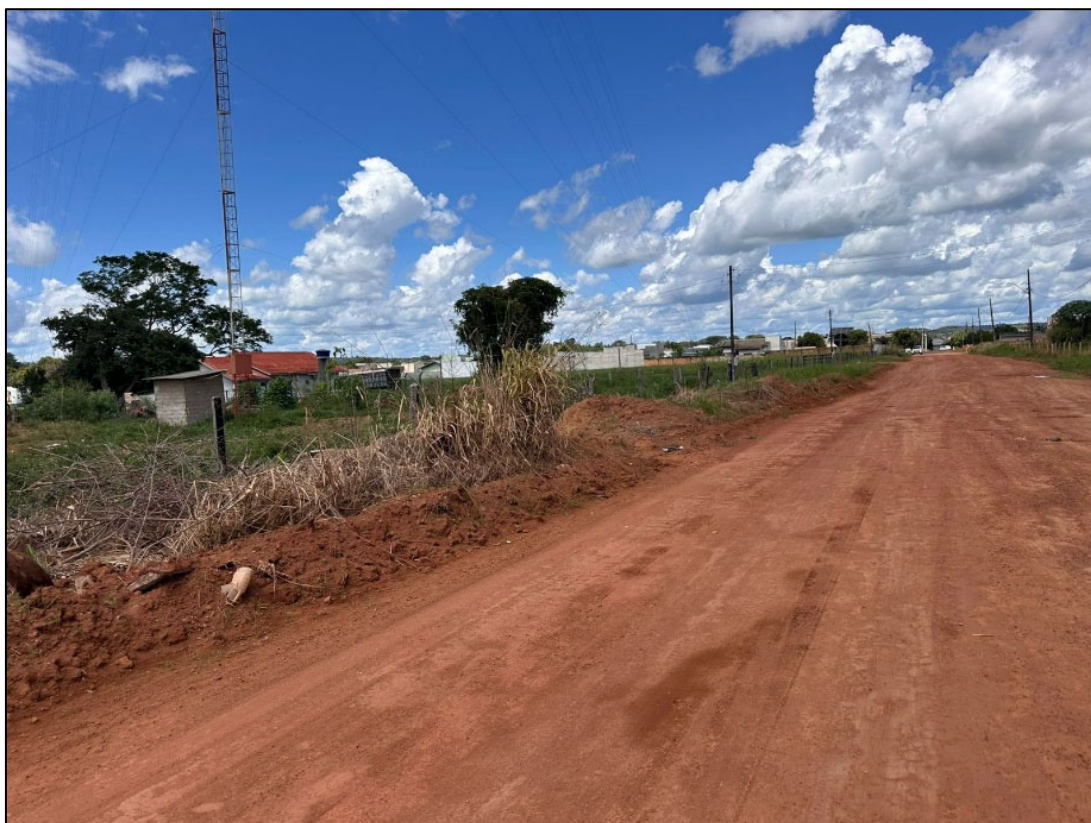
Figura 9 – FOTO BORDO DA PISTA