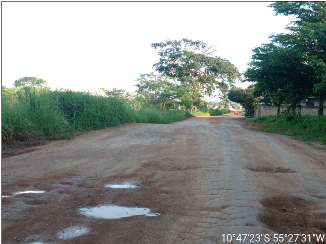
Figura 3 - FOTO EIXO VIA