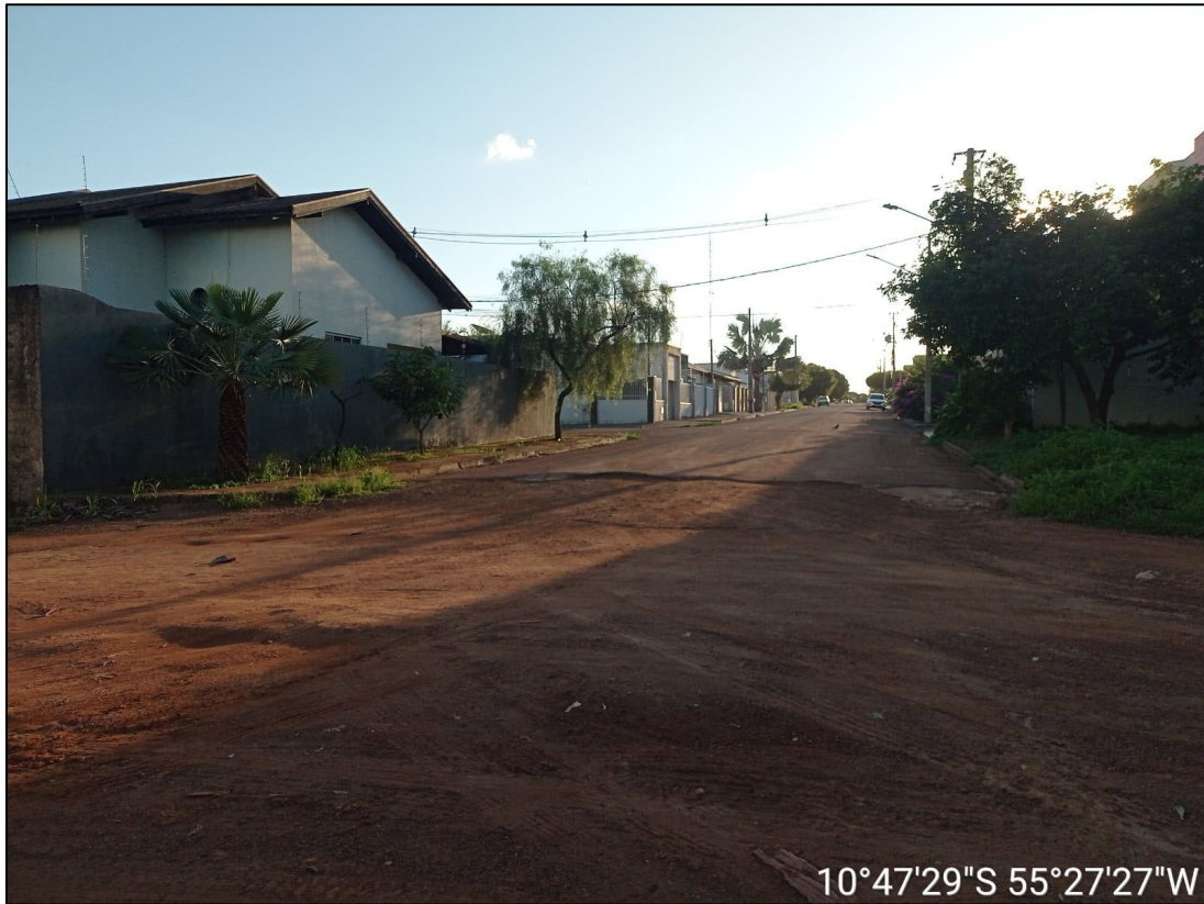
Figura 7 – FOTO PRIMEIRA ESQUINA COM ASFALTO