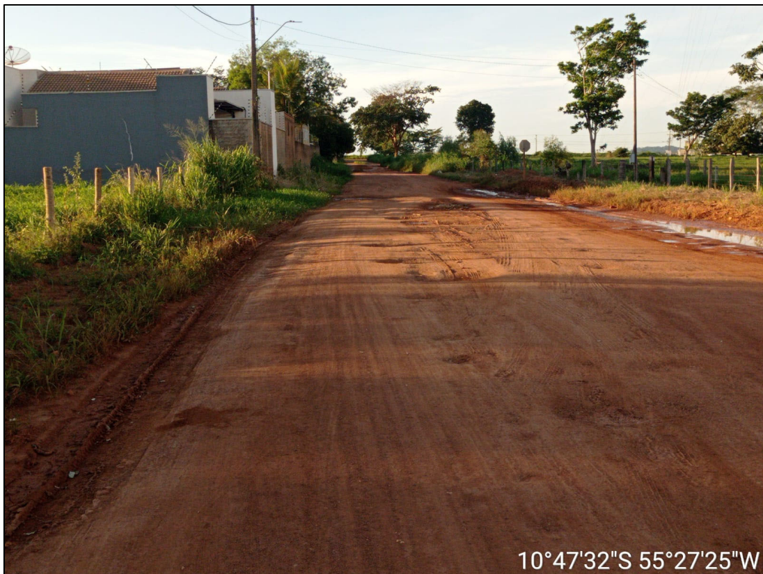
Figura 8 – FOTO BORDO DA PISTA