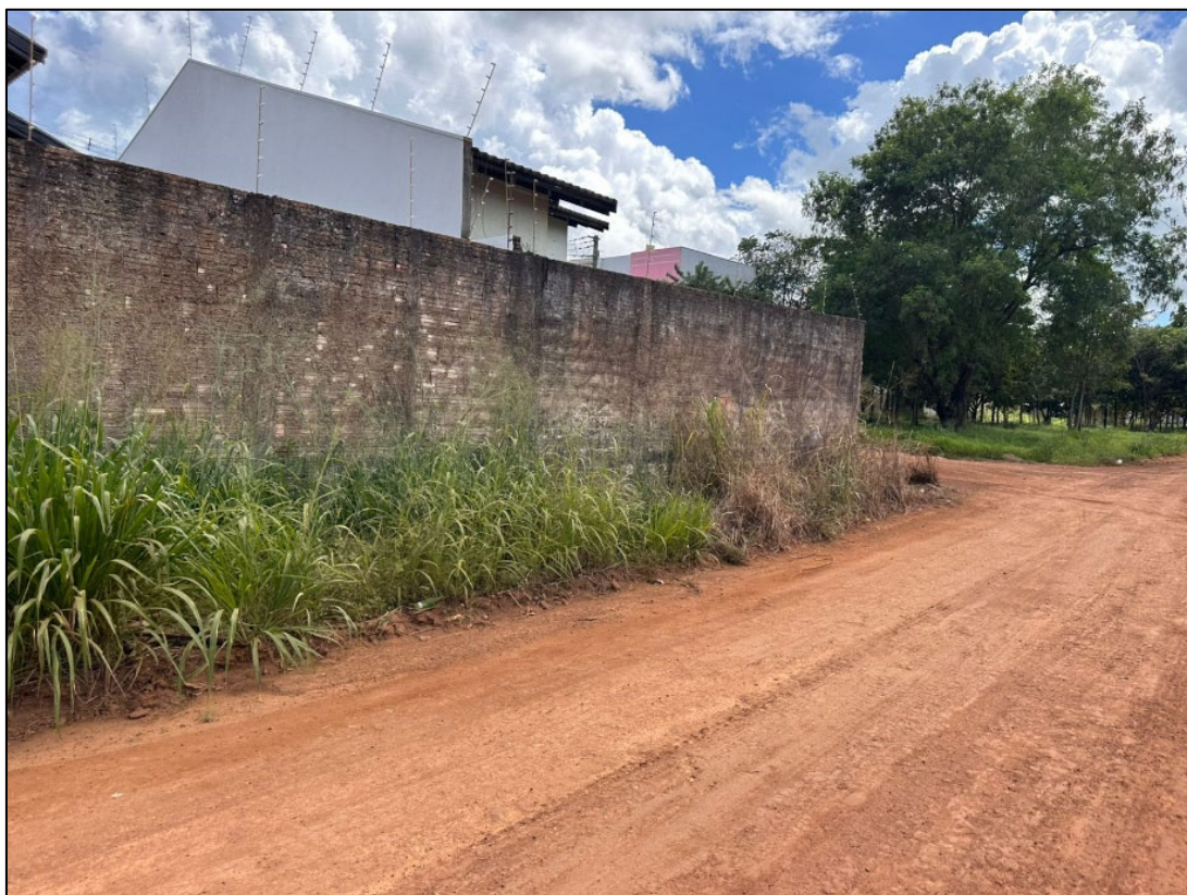
Figura 10 - FOTO BORDO DA PISTA