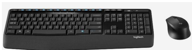
Imagem comparativa do item 05