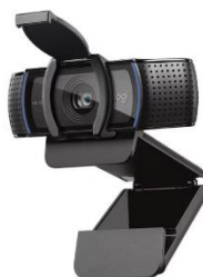
Imagem comparativa do item 16

1.2.16.5. Modelo igual ou superior à Webcam Logitech C920s, FULL HD 1080, C/ 2 Microfones.