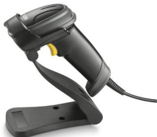
Imagem comparativa do item 06

1.2.6.5. Modelo igual ou superior ao Leitor de Código de Barras e QR Code Imager 1D 2D de Mão com Pedestal Elgin EL250 USB - Iê Nota Fiscal Eletrônica Boleto Bancário e Tela