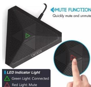
Imagem comparativa do item 09

1.2.9.5. Modelos de referência: Microfone De Conferência CMTECK modelo Cm003 Usb ou Microfone De Conferência CMTECK modelo Cm001 Usb