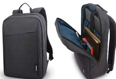
Imagem comparativa do item 10

1.2.10.4. Produto igual ou superior à: Mochila casual B210 para laptop Lenovo de 15,6 pol.