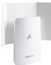
Imagem comparativa do item 11

1.2.11.8. Modelo igual ou superior: Modem Roteador Externo 4G GSM Aquário Branco - CPE-4000SX.