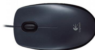
Imagem comparativa do item 12

1.2.12.6. Modelo igual ou superior ao Mouse USB Logitech M90 1000 Dpi Preto