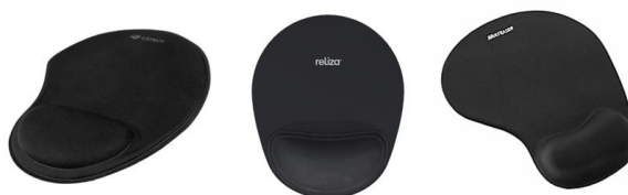
Imagem comparativa do item 13