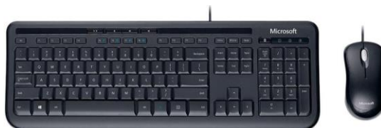
Imagem comparativa do item 04

1.2.4.4. Modelo igual ou superior ao KIT MICROSOFT TECLADO E MOUSE 600 WIRED DESKTOP 600 MULTIMIDIA ABNT2 - APB00005.