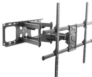
Imagem comparativa do item 14

1.2.14.7. Modelo igual ou superior ao Suporte TV Articulado 55 a 90 A02V8XL ELG Telas Gigantes