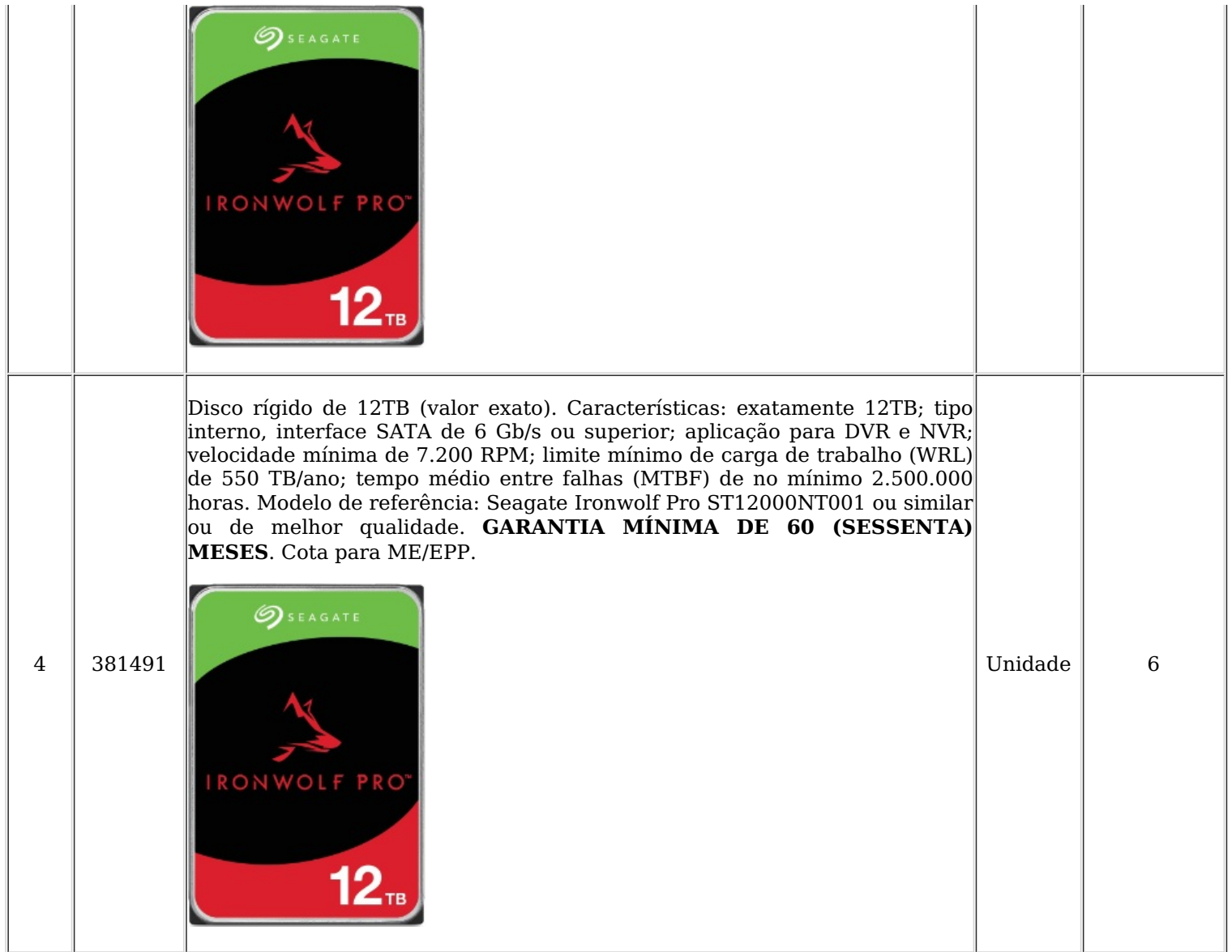
Tabela 1 - Estimativa das quantidades.

1.2. Os quantitativos de itens são os discriminados na tabela acima.