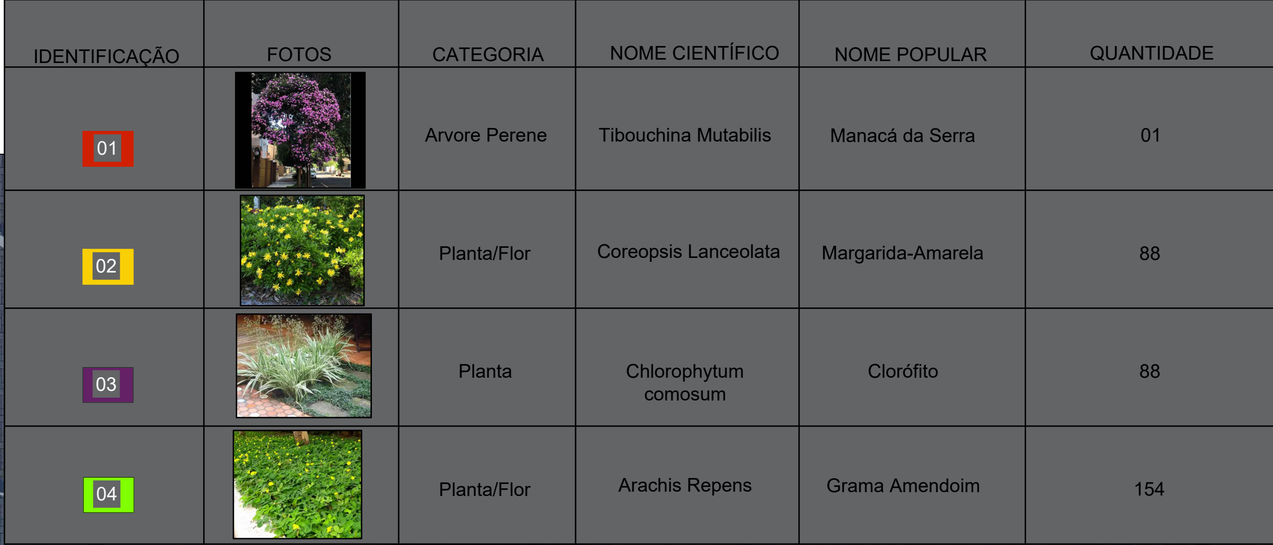
TABELA DE PLANTAS UTILIZADAS NO PROJETO