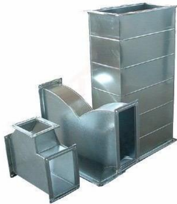
Figura 4 - Dutos metálicos - foto ilustrativa

A fixação dos dutos deverá ser apoiados em cantoneiras de aço ou em perfis de aço carbono galvanizado. Em estruturas metálicas, serão utilizadas barras roscadas com porcas e contra-porcas, bem como braçadeiras de aço. Em lajes ou vigas de concreto, serão utilizadas barras rosqueadas em chumbadores, do tipo CBT, fixados diretamente no concreto ou então diretamente fixados nas estruturas metálicas.