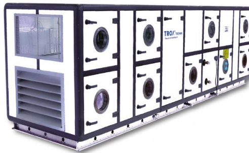
Figura 1 – Imagem representativa do modelo de fancoil

Todas as unidades de tratamento de ar deverão possuir caixa elétrica para força e comando incluindo inversor de frequência, controlador microprocessado, medidor de vazão, sensor de pressão, chave manual/automática, led sinalização. A caixa elétrica deverá vir montada e configurada de fábrica com classe de proteção adequada para uso.