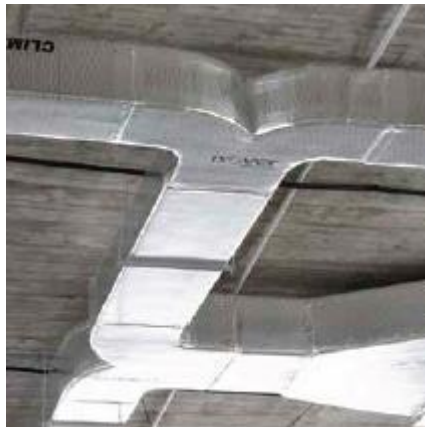
Figura 3 - Duto fabricado com isolamento térmico

Estes dutos ser isolados termicamente com manta de lã de vidro aglomerada com resinas sintéticas, com barreira de vapor, revestimento reforçado, espessura mínima de 25mm, resistência térmica mínima de 0,8 m 2 °C/W. Referência ISOFLEX, fabricação ISOVER colada com adesivo apropriado.