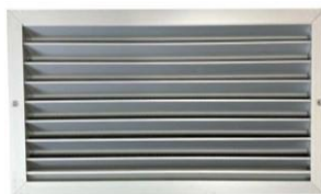
Figura 5 - Veneziã externa

A interligação com a rede de dutos deve ser realizada de forma a garantir a classe de estanqueidade do projeto.