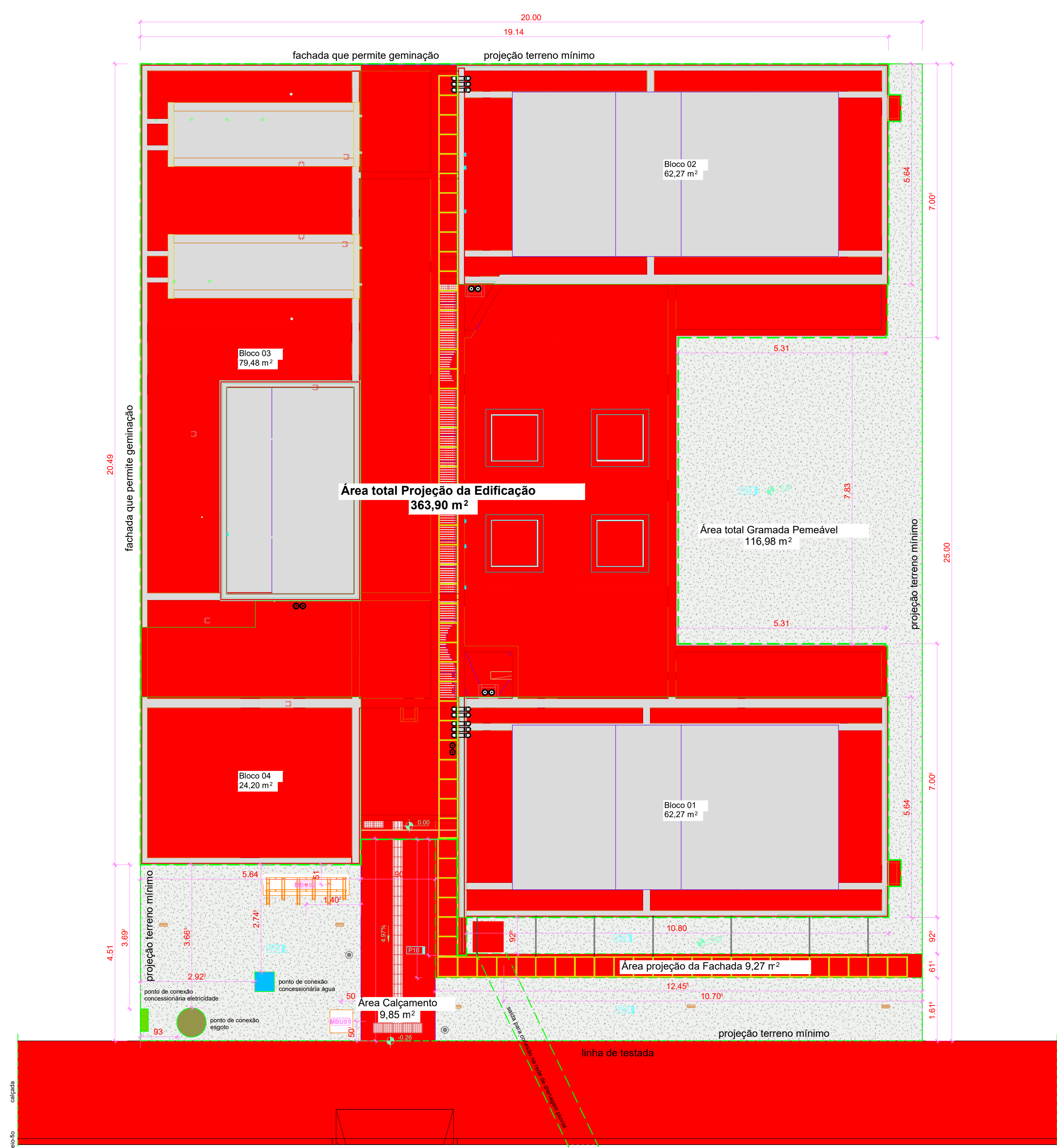
1 IMPLANTAÇÃO 1:75