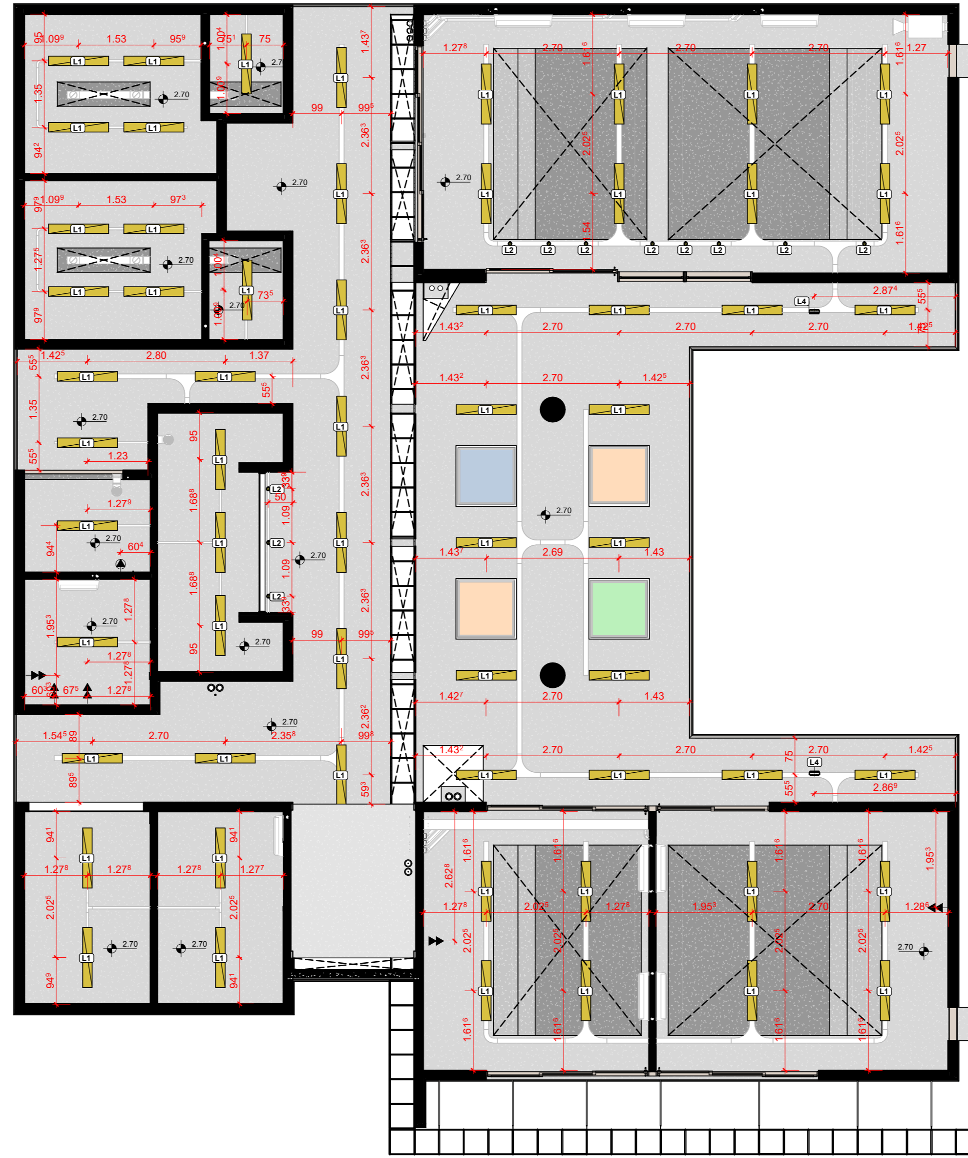
2 A501(NBE00) Planta de Forro Pontos de Elétrica 1:75