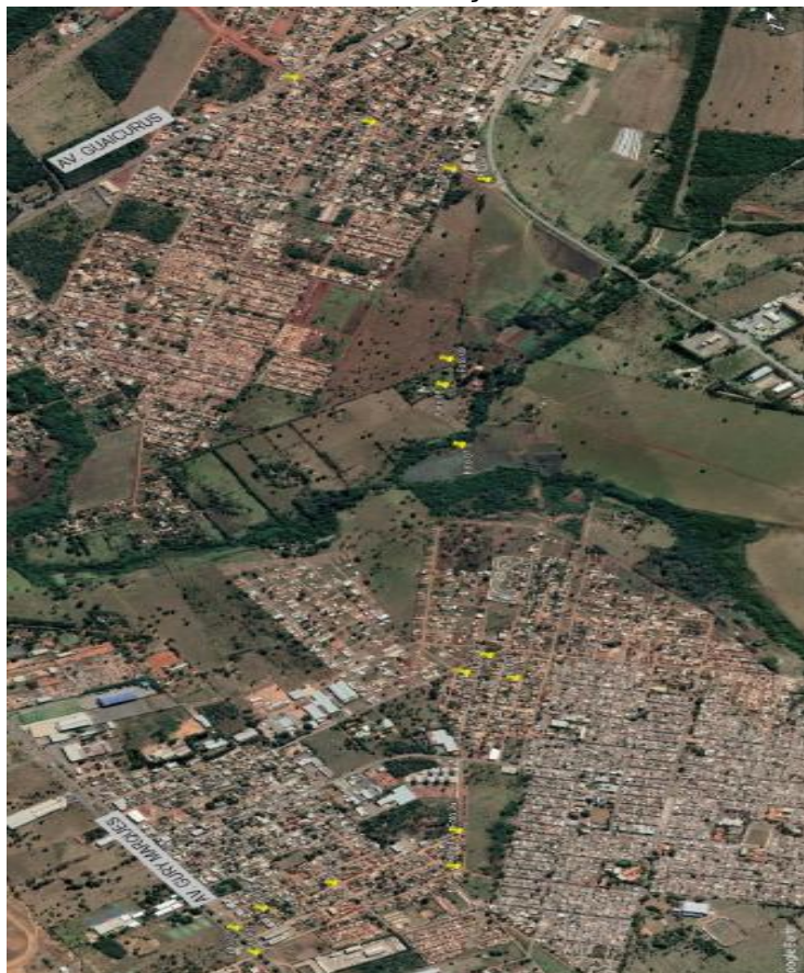
FIGURA 1 – LOCALIZAÇÃO DA OBRA