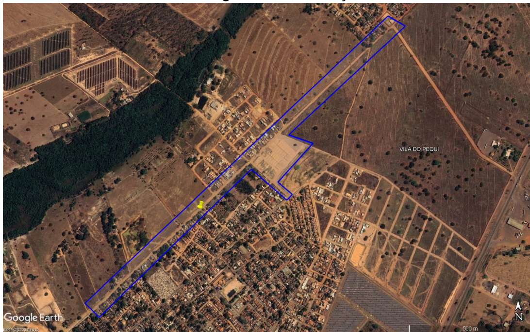
Figura 01 – Localização

ESTADO DE MATO GROSSO DO SUL PREFEITURA MUNICIPAL DE COXIM