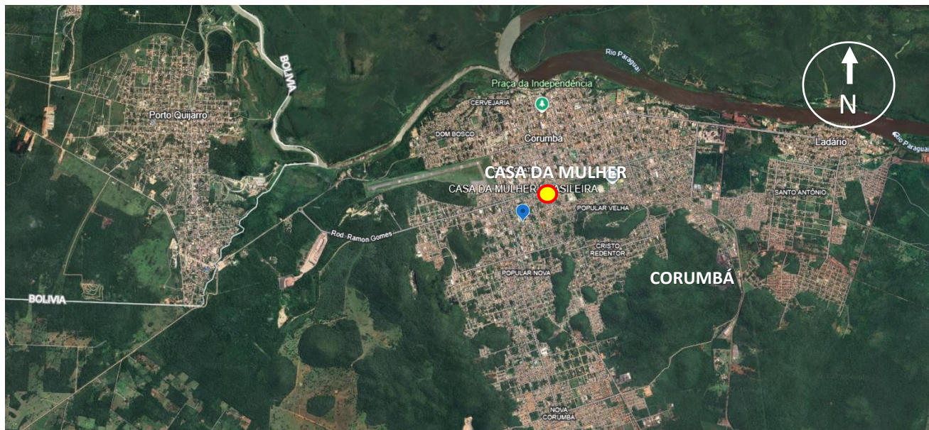
Localização da área da Construção da CASA DA MULHER BRASILEIRA-MS

a uma ampla região, otimizando a logística operacional e proporcionando melhor atendimento à população local.