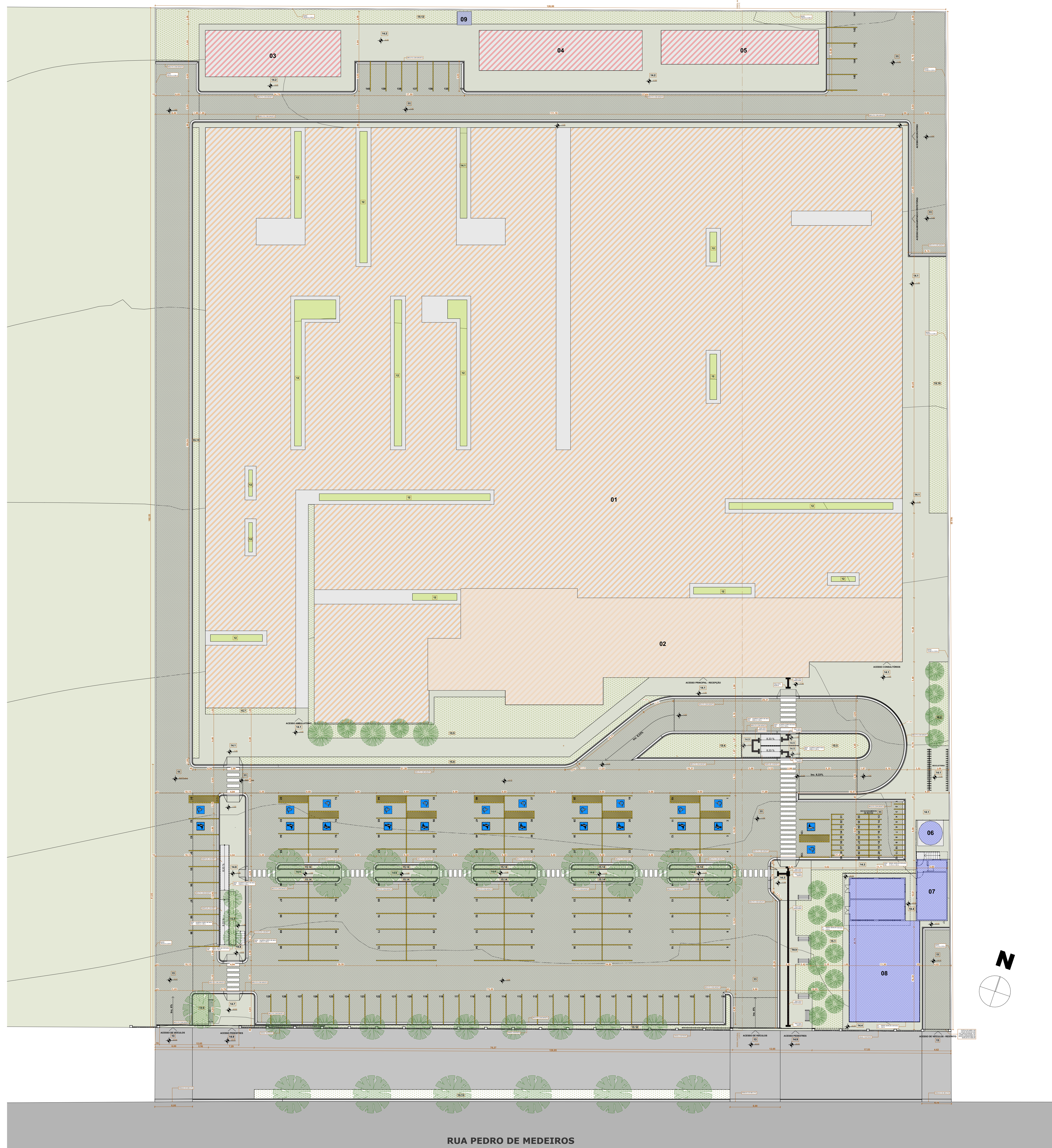
1 IMPLANTAÇÃO 1:250