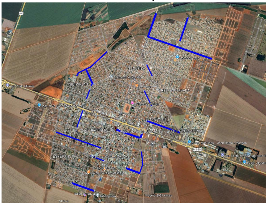
FIGURA 1 – LOCALIZAÇÃO DA OBRA