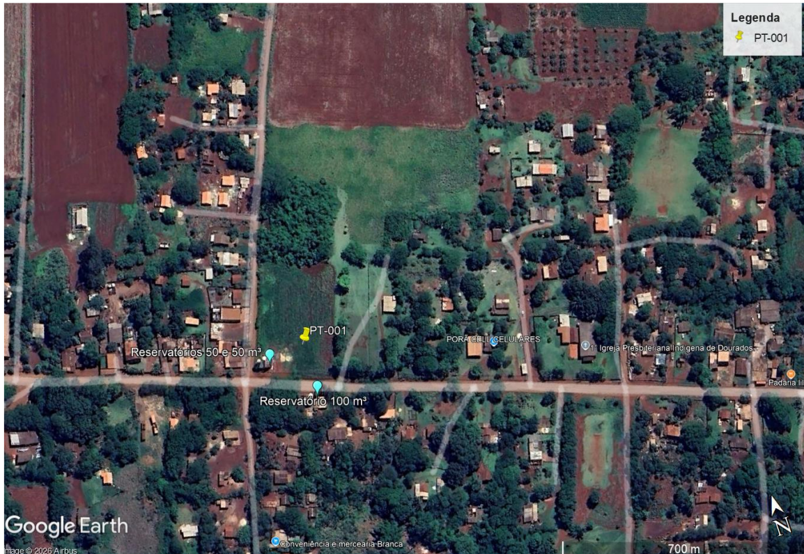
Figura 1 – Mapa de localização