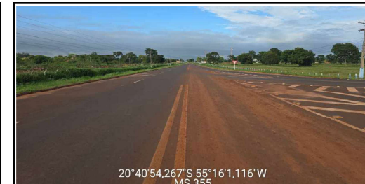
FOTO 09 MS-355