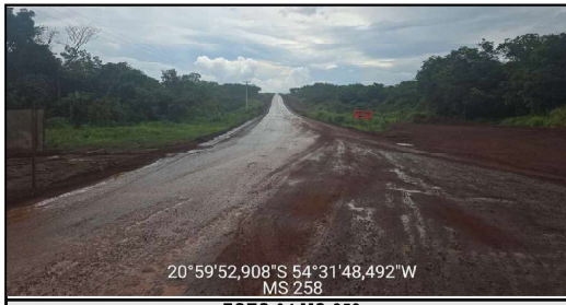
FOTO 04 MS-258