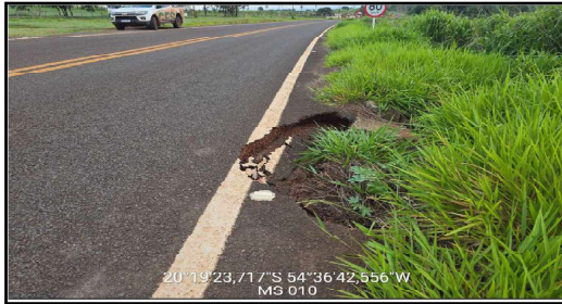
FOTO 01 MS-010