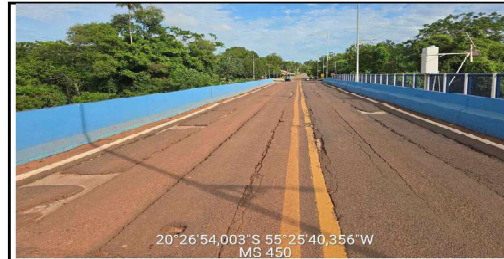
FOTO 10 MS-450

20°29'44,825"S 55°32'33,043"W MS 450 (Entr. BR 262)