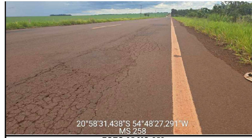
FOTO 05 MS-258