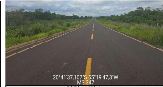
FOTO 06 MS-347