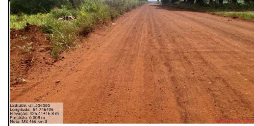
FOTO 14 MS-457

Latitude: -21,329386 Longitude: 54,746406 Altitude: 424,411 m Precisão: 0,008 m Nota: MS 466 km²