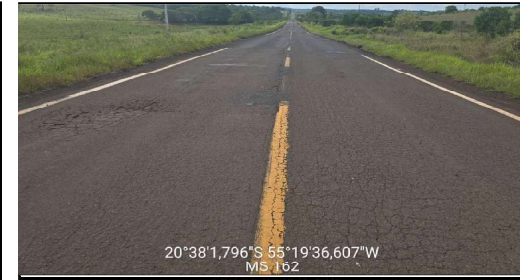
FOTO 03 MS-162