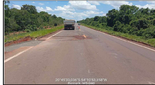
FOTO 02 MS-040