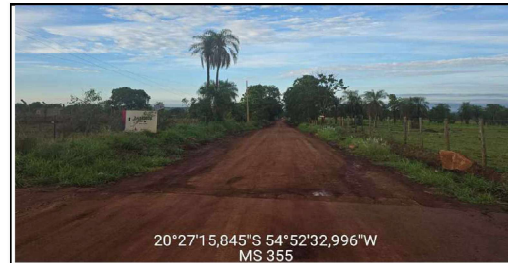
FOTO 08 MS-355