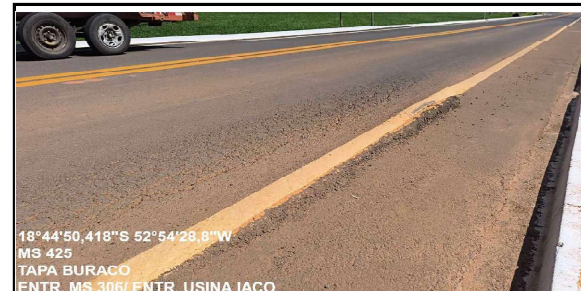
FOTO 06 MS-425