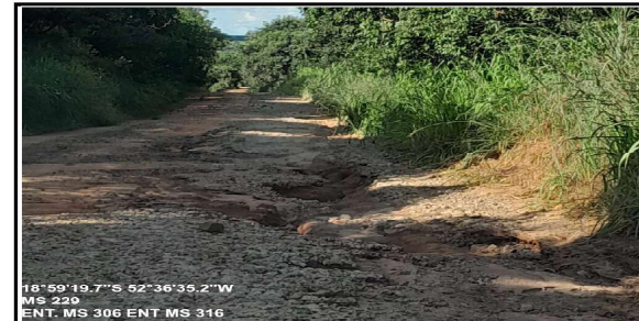
FOTO 03 MS-229