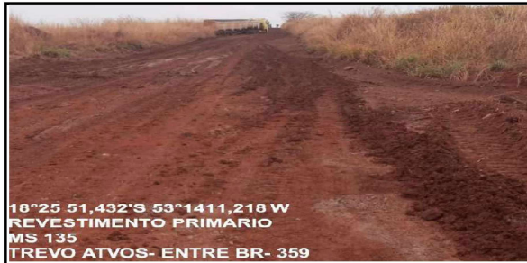
FOTO 01 MS-135