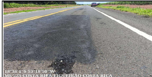
FOTO 02 MS-223