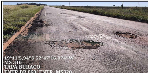
FOTO 04 MS-320