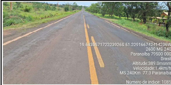
FOTO 10 MS-240