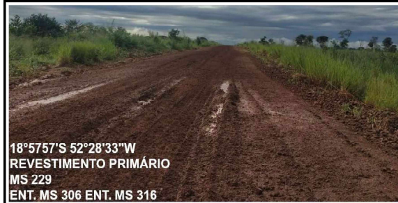
FOTO 11 MS-229