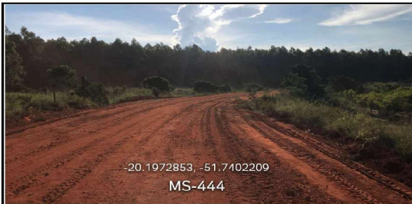
FOTO 13 MS-444