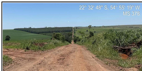
Foto 07 MS-378