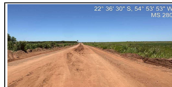
Foto 06 MS-280