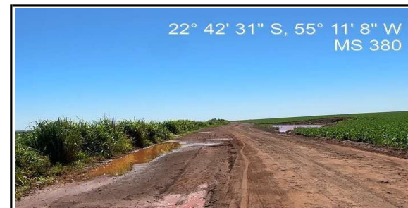
Foto 09 MS-380