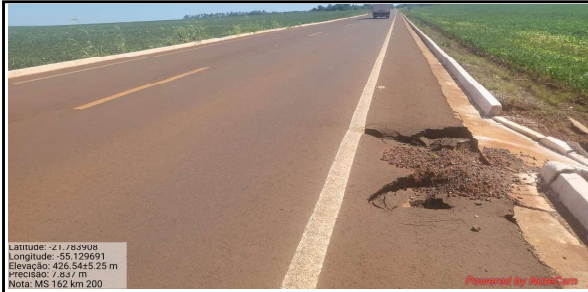
Foto 03 MS-162

Latitude: -21.753905 Longitude: -55.129591 Elevação: 426.54±5.25 m Precisão: 7.631 m Nota: MS 162 km 200