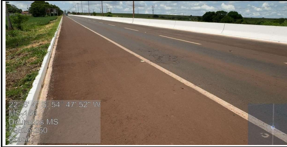
Foto 01 MS-156

22° 5' 43" S, 54° 47' 52" W MS-156 Domésticos MS 23/02/2026 13:50