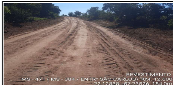
Foto 07 MS-471