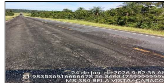
Foto 09 MS-384