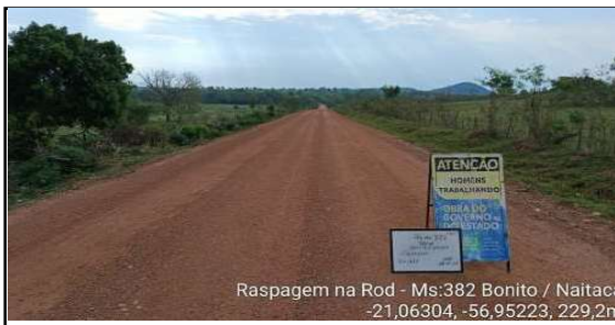
Raspagem na Rod - Ms:382 Bonito / Naitaca -21,06304, -56,95223, 229,2m