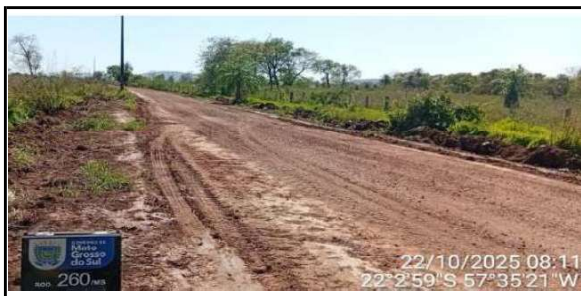
Foto 10 MS-260